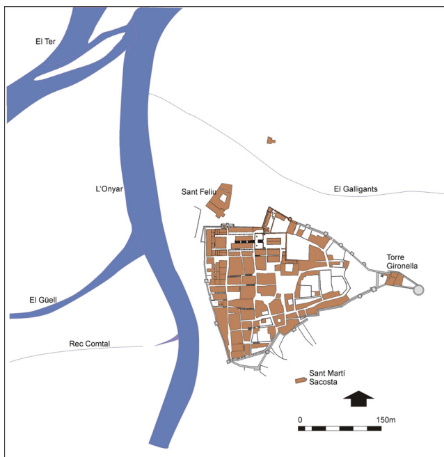
Fig. 1 Plànol de la ciutat d'època carolíngia amb l'eixample nord consolidat i amb l'episcopi de Sant Feliu fora muralles.

coincideix fil per randa amb l'actual Força Vella, cosa que significa que el creixement urbà subsegüent, sobretot tangible des de finals del segle X, ho