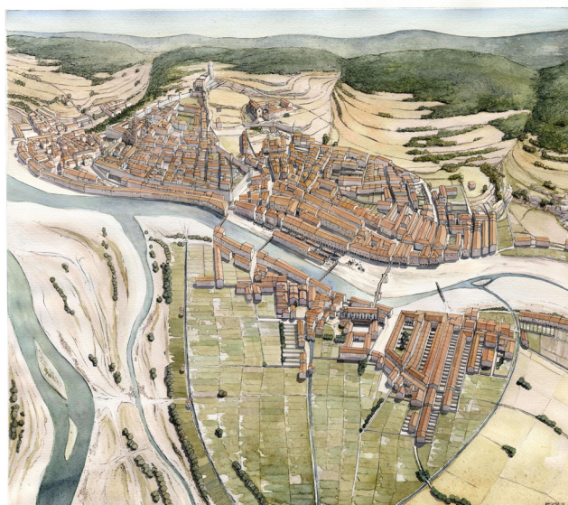
Fig. 7. Recreació aèria de la ciutat a mitjan segle XIV.

En una data imprecisa del segon quart del segle XIV, l'aljama va decidir construir un micvé, car la sinagoga no en disposava. Fins aquell moment s'havien utilitzat els banys públics del burg de Sant Feliu, els actuals banys àrabs, que es llogaven puntualment amb aquesta finalitat. Els banys jueus es van ubicar vora la sinagoga en un solar al costat exterior de la muralla del carrer de les Ballesteries. Es va