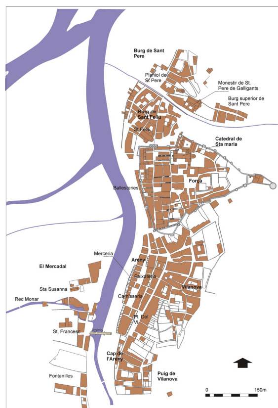
Fig. 4. Mapa de la ciutat a mitjan segle XIII.

Un d'aquests barris va ser la Vilanova i el Puig, és a dir, la zona que s'enfila per les Gavarres des del rectorat de la universitat fins a la Mercè passant pel carrer del Portal Nou amb totes les travessies. A priori era una de les zones més complexes per l'orografia abrupta. Des de la segona meitat del segle XII, algunes famílies com els Ripoll, els Puig i ja en el segle XIII, els Martí i altres, compraven cases i finques i hi realitzaven establiments. Paral·lelament, envers la primera meitat del segle XIII, es construïa un mur de contenció, descrit en els documents