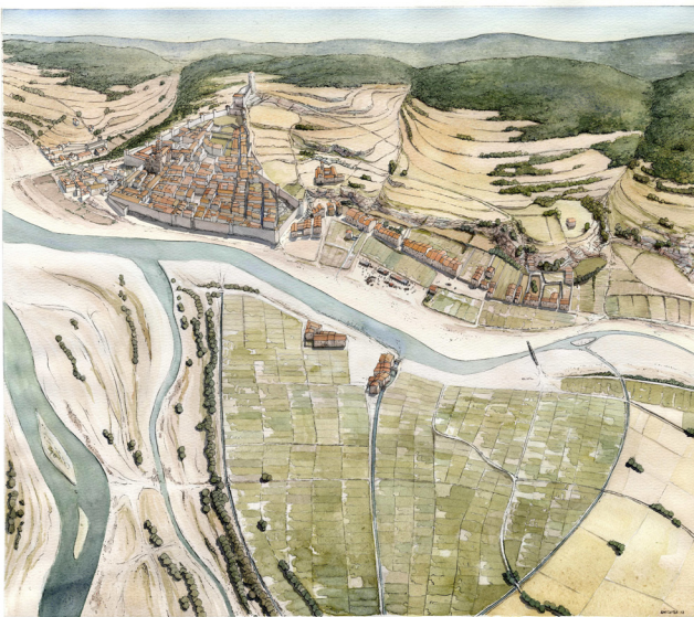
Fig. 3. Recreació aèria de la ciutat a mitjan segle XII.

lògica urbanística. Recordem que tot aquest espai tingué un forn documentat des de molt antic que no tindria raó de ser sense una base demogràfica suficient. És més que probable que l'existència d'un mercat estacional a l'areny del riu, actués d'esca en aquell procés.