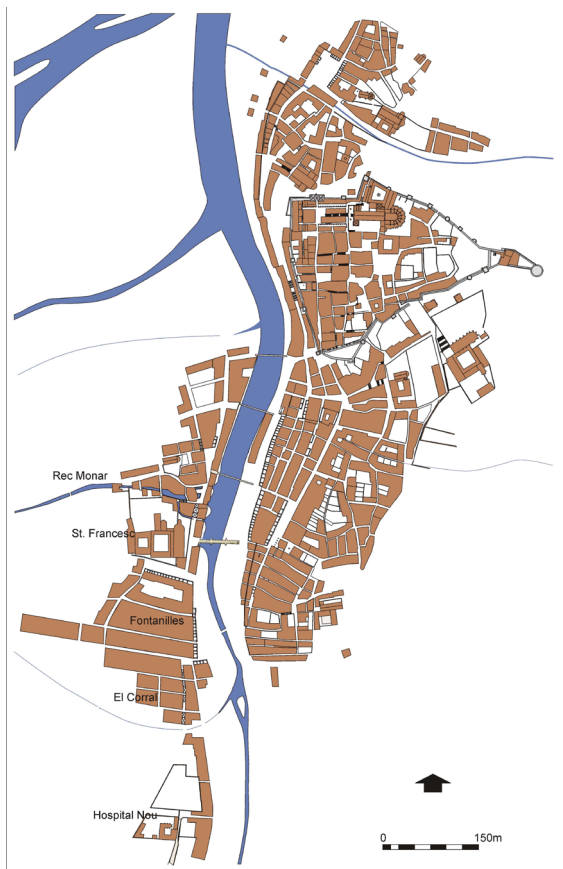
Fig. 6. Plànol de la ciutat cap a mitjan segle XIV.

Les respostes i solucions urbanes a la densificació tampoc foren innovadores però ara s'incrementaven. Un dels efectes fou el creixement vertical de les cases amb edificis de fins a quatre pisos i l'ús sistemàtic de parets mitgeres, és a dir, comunes o compartides per dos habitatges que es convertia en una pràctica habitual a tota la ciutat. L'economia d'espai va influir en la minva d'amplada dels solars. Veiem que, el 1322, els solars dels primers establiments per bastir les cases de la galta esquerra del carrer Calderers sota l'impuls de Ferrer de Lillet, amidaven quatre canes i mitja d'amplada (uns set metres). Els que es feren més endavant havien reduït l'amplada a tres canes i dos pams (menys de cinc metres), tal i com corrobora el capbreu reial del 1350 sobre les cases i patis del mateix sector 16 . Aquesta mida al voltant de les tres canes és la que es va implantar com a amplada de referència de tots les cases i solars dels carrers de les Savaneres i Canaders. 17