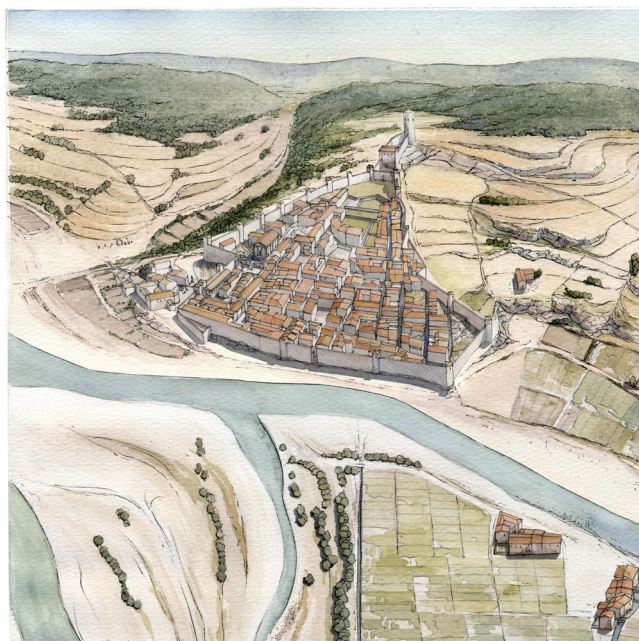
Fig. 2 Recreació a vol d'ocell de la ciutat carolíngia vista des del sud-oest.

Les circumstàncies històriques van propiciar un important creixement demogràfic a partir del segle X, especialment de la segona meitat, que es feu sentir sobretot en espais urbans. Calia tenir cura de més gent, situar-los en nous establiments atès que no tenien cabuda dins dels murs urbans. Aquesta primera expansió, encara tímida, es feu sentir al burg de Sant Feliu, a l'entorn de la basílica del màrtir, però també