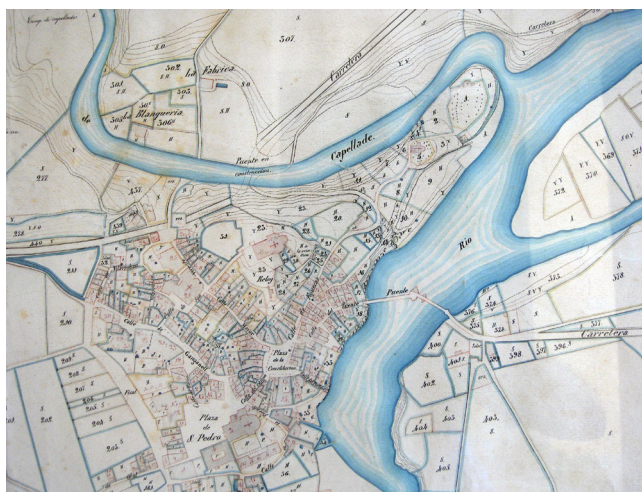
Figura 6. Plànol de Joan Papell de 1862 (Ajuntament de Besalú). Tot i els anys de diferència, segueix essent un document molt valuós per estudiar i entendre l'urbanisme baixmedieval de Besalú.

Finalment, en una darrera categoria quedarien carrerons i passos menors entre illes de cases, generalment molt estrets, que responien a drets de pas o passos de servitud. Malgrat que eren molt comuns, la majoria d'ells van desaparèixer al llarg dels segles XVIII i XIX, fruit de la compra i unió de finques, si bé una minoria encara es conserva, com el petit pas amb escales existent entre la plaça dels Jueus i el carrer del Pont. Altres, encara que tapiats, poden ser igualment reconeguts, com l'antic caminet que pujava al Torell entre illes de cases —situat al colze del carrer Vilarrobau—, o el pas que connectava el carrer Ganganell amb l'interior del pati d'illa de Can Cambó, visible encara en el plànol de Joan Papell de 1862 (Fig. 6).