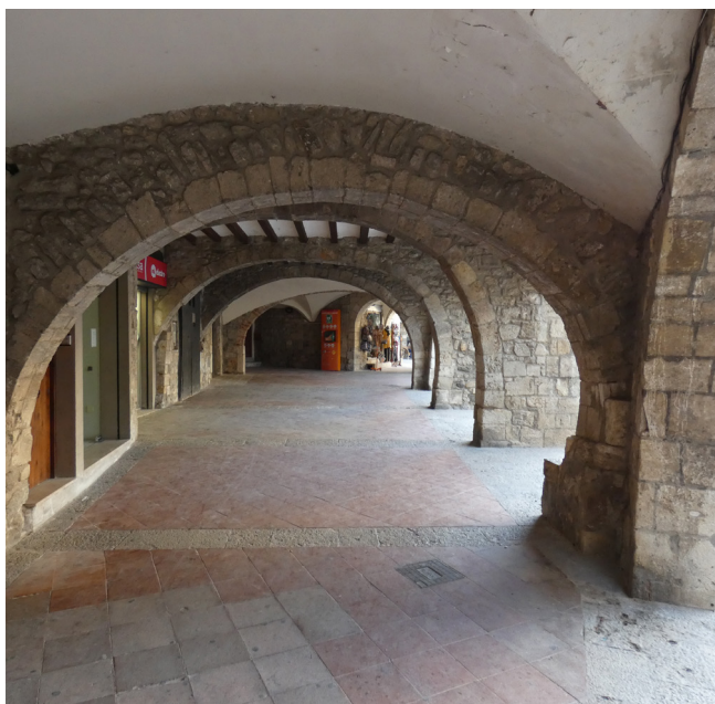
Figura 4. Detall dels porxos de l'actual plaça de la Llibertat, que garantien que l'activitat comercial prosseguís en cas de mal temps. Al llarg dels darrers segles el nom de la plaça ha anat canviant segons el moment polític del país: plaza de la Constitución, plaza de la República, plaza de España...

La població estava dividida en dos centres neuràlgics diferents. D'una banda hi havia la plaça porxada, que representava el poder civil i econòmic de la població: era el lloc on se celebraven el mercat i les fires, on hi havia les mesures locals de gra, on es reunien les autoritats municipals (Mir 1995, 114)... Tenia un paper actiu en la vida de la vila —el trobador Ramon Vidal de Besalú, sense anar més lluny, situa a la plassa de Bezaudun una part de l'acció de la seva obra Abril Issia — i en ella hi convergien els grans carrers d'entrada i sortida de la població, que menaven a Figueres, Girona i Olot respectivament (Fig. 4). L'altre punt destacat era el puig de