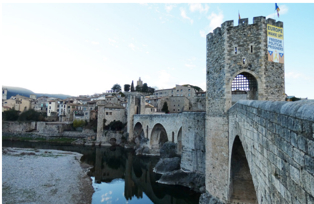
Figura 2. Vista del perfil urbà de Besalú des del pont vell. S'aprecia l'important desnivell existent entre la riba del Fluvià i el capdamunt del turó de Santa Maria, amb gairebé 40 metres de diferència.