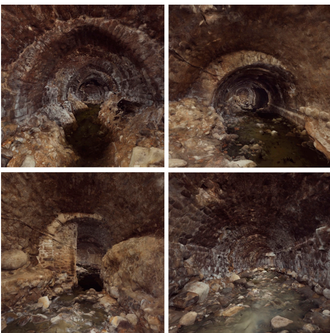
Figura 3. Model fotogramètric del torrent de Ganganell, cobert entre finals del segle XIII i la primera meitat del XIV. (Bruno Parés - Ajuntament de Besalú).

La bonança dels segles XII i XIII deixà novament petit l'espai d'intramurs i ben aviat van començar a aparèixer nous ravals, el més important dels quals fou el de Capellada, situat a l'extrem oriental de la població, que fins i tot disposava de parròquia pròpia ubicada a l'església de Sant Martí (1104). El 1171 era l'abat de Sant Pere qui rebia autorització del rei Alfons per edificar sobre una part del cementiri situat al davant del monestir (Sagrera 2010, 11), fet que desembocaria poc després en la formació del Prat de Sant Pere, que des d'un inici degué tenir una forma similar a l'actual. La densificació de la zona emmurallada era tanta, que fins i tot s'optà per enderrocar una part de la muralla del Ganganell i cobrir la riera homònima, que dividia la població en dos, a fi de guanyar espai urbanitzable. El procés de cobriment de la riera, completat entre finals del segle XIII i la primera meitat del XIV, fou un autèntic repte arquitectònic consistent en