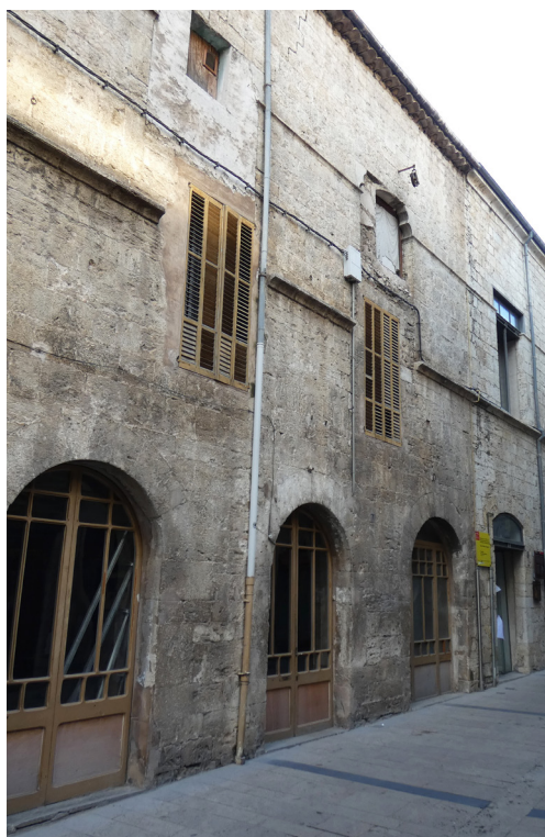
Figura 7. El casal medieval de la família Sant Romà, situat al carrer Major, és un dels exemples de residència nobiliària millor conservats de la vila. A inicis del segle XX l'edifici era propietat de la família benestant Cambó.