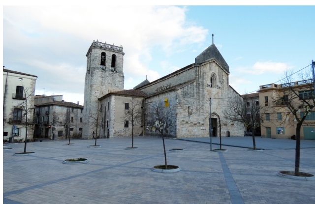
Figura 5. Vista general del Prat de Sant Pere, amb l'antiga església del monestir benedictí. Els límits d'aquesta plaça de grans dimensions han variat molt poc des de la baixa edat mitjana.

Ben diferent, en canvi, és l'origen d'altres places com el Prat de Sant Pere, la placeta de Sant Vicenç o la desapareguda plaça del Bell-lloc, totes elles formades al damunt d'una zona de necròpolis a l'entorn d'un temple. Es tracta, doncs, d'espais públics configurats a partir de cementiris que no havien de ser forçosament