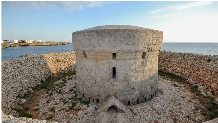
Figura 3. “Torre des Castellar”. Autor Extret de https://infomapas.com/portfolio-item/sa-cova-de-ses-tres-boques/

La zona de los cuatro cañones estuvo situada a pie de tierra; su diseño interior es diferente y tiene dos alas añadidas a la torre. En la otra parte de la isla