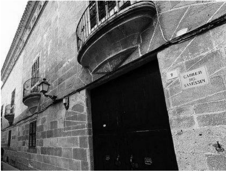
Figura 10. “Palau dels Marquesos d’Albranca”. Autor: Extret de https://laciutatnoble.com/index.php/palau-de-cas-duc-marquesos-dalbranca/

L'interior es configura seguint el model ciutadellenc de les cases senyorial, amb la gran