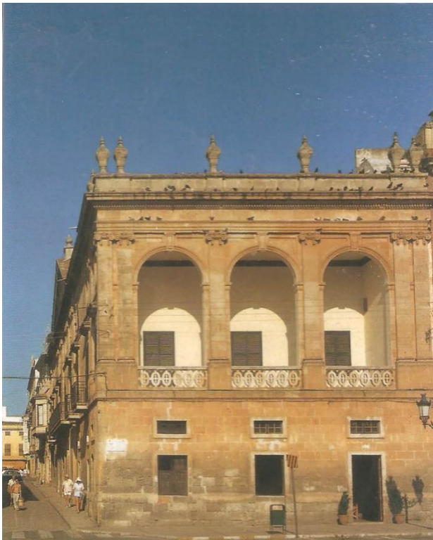
Figura 15. "Palau Salort".

trapezoidal coronen la façana "El cos central, lleugerament ressortit respecte dels altres,