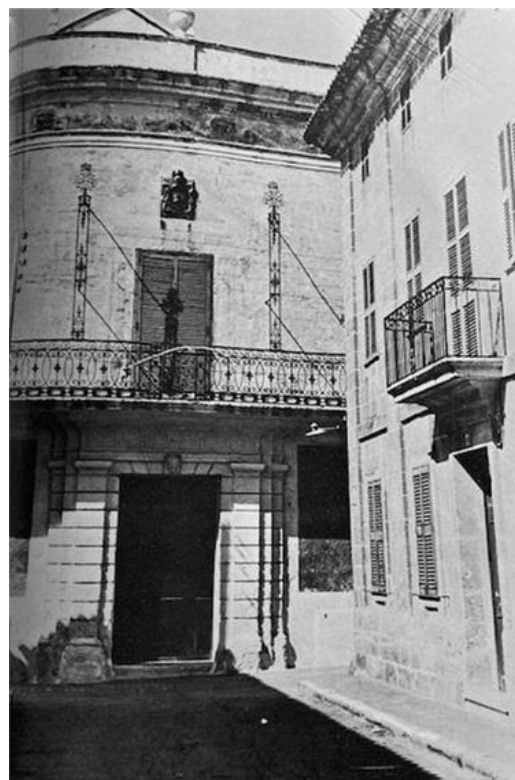
Figura 12. "Can Squella". Autor: Jaume Fedelich Bosch i Ignasi Casanovas Anglada. Extret de Ciudadela de Menorca en text i imatge .

La façana correspon a un barroc italianitzant, és molt diferent respecte les dels altres palaus ciutadellencs on predomina el marès, aquí els murs són pintats de groc pastel combinat amb blanc, fugint així de l'austeritat i sobrietat que tant caracteritza les altres cases senyoriales. La porta principal està remarcada per un voluptuós encoixinat i presidida per un rostre petri velat, a la part superior hi ha un fris decorat amb tríglifs i mètopes, un marc blanc a les finestres les ressalta, a més a més, a sobre, es troben pintures que representen garlandes, element molt típic del segle XVIII, cariàtides sustenten les pilastres jòniques (vegeu figura 13). La segona planta compta amb un llarg balcó centrat en una barana de ferro i ferratges, l'escut del llinatge Squella es deixa