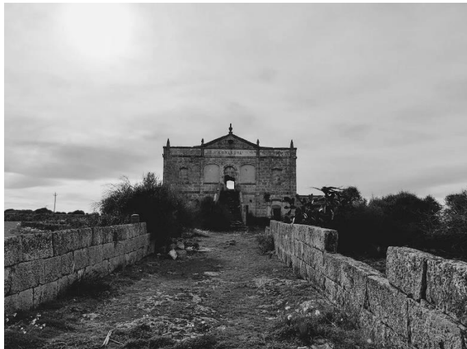
Figura 6. "Vila Bonanova". Autor.

L'entrada de la vil·la està marcada per dues torretes de planta quadrada amb la part superior que ascendeix a una forma triangular coronat per un vas, els elements marquen l'inici del camí recte que acaba a la façana, és a dir, el camí connecta visualment amb la façana essent un treball de perspectiva que aporta simetria, equilibri i ordre.