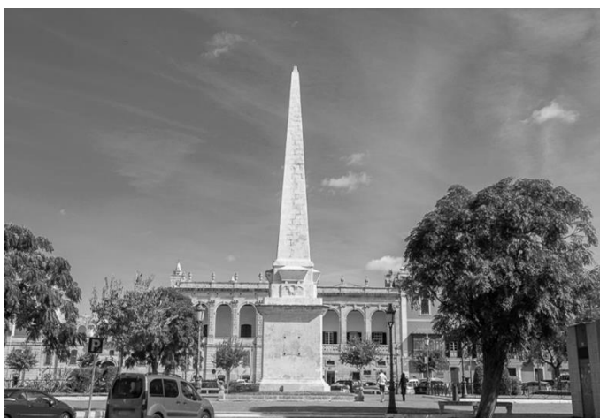
Figura 1. "Obelisc de la plaça des Born". Autor: Menorca tour. Guia virtual de la isla de Menorca. Extret de Plaza des Born. https://menorcatour.com/menorca/pueblos/ciutadella-de-menorca/plaza-es-born.html

Posteriorment, amb el Califat de Còrdova els musulmans varen expandir més la ciutat que en temps dels romans, comptava amb cementiris, tallers, banys, etc., es construïren diverses mesquites i una de principal en el que avui en dia és el nucli urbà de Ciutadella, actualment és la Catedral de Santa Maria la qual ha convertit el minaret en campanar, d'aquí la planta quadrada. Es té constància de la presència d'un castell, l'Alcàsser, l'única fortificació, avui en dia és l'Ajuntament, el pati d'Armes ara és la plaça del Born on en el