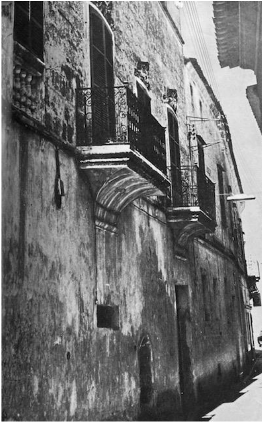
Figura 7. "Façana de la Casa LLuriach o palau del Baró Lluriach". Autor: Jaume Fedelich Bosch i Ignasi Casanovas Anglada. Extret de Ciudadella de Menorca en text i en imatge .

El palau presenta un enfront molt auster, destaquen els balconets rectangulars amb