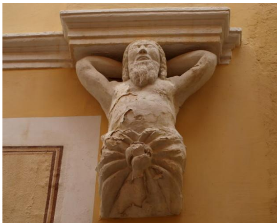
Figura 13. "Cariàtide de Can Squella". Autor. Extret de https://www.autosvivo.com/blog/palau-squilla-joya-patrimonial-del-casco-viejo-de-ciudadella/

motiu que es justifica en les arrels italianes del llinatge Squella, pot ser, viatjaren al seu país on s'influenciaren de l'art, i en tornar a l'illa aplicaren allò vist "La inspiració italianitzant s'explicaria en el fet que els caps de les dues famílies pertanyien al mateix llinatge i havien viatjat a Itàlia" 82 .