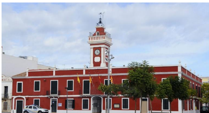
Figura 5. "Ajuntament des Castell". Autor. Extret de https://menorcaaldia.com/2020/05/04/es-castell-destina-196-000-euros-a-luchar-contra-el-covid-19/

A la plaça de S’Esplanada d’Es Castell s’hi troba l’ajuntament (vegeu figura 5) i el museu militar, els dos edificis de façana vermella tanquen l’antiga plaça d’armes, juntament amb altres arquitectures que havien estat antigament casernes. S’Esplanada és important ja que