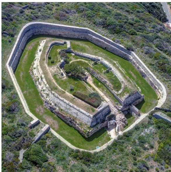
Figura 2. "Vista aèria del Fort Marlborough". Extret de Fort Marlborough, Es Castell. https://www.inspirock.com/spain/es-castell/fort-marlborough-a6273029583

Situat també en la vorera sud de l'obertura del port, es va aixecar entre els anys 1720-