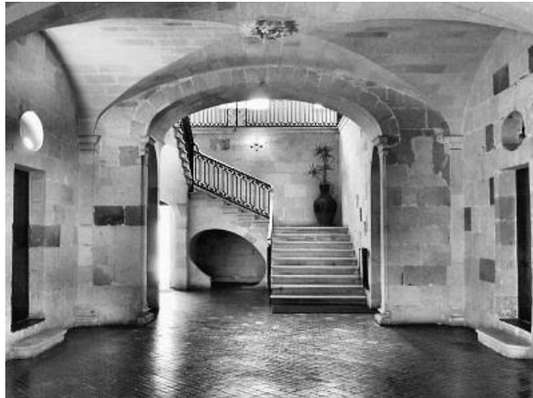
Figura 14. "Vestíbul i escala del palau Salort". Autor. Extret de http://www.menorcaweb.com/fotos-menorca/ciudadella/llocs-interes-cultural/palau-salort/

El palau fou edificat l'any 1813, seguint també el model de la planta noble ciutadellenca amb una escala, però de triple volta (vegeu figura 14). La façana del carrer Major des Born, està composta per una sèrie de grans obertures coronades per finestres rectangulars, a sobre, balcons coronats amb una successió de nínxols cecs circulars. El cos principal sobresurt amb la presència de pilastres jòniques, una cornisa dentellada i un timpà l·lis coronat per una hidra sobre un basament