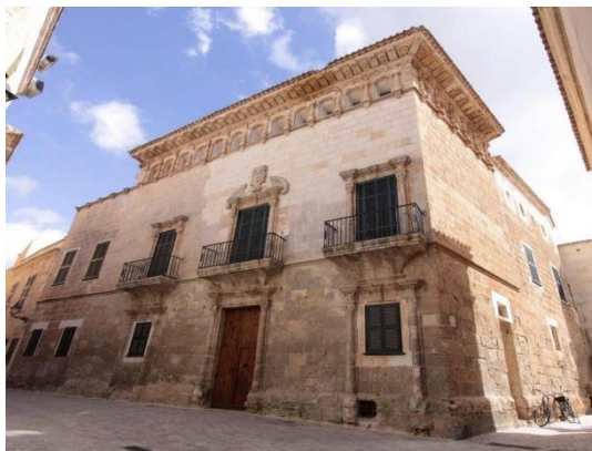
Figura 9. "Palau Saura". Autor. Extret de https://www.menorca.info/menorca/local/2019/10/23/669457/ciutadella-aprueba-obras-para-convertir-can-saura-museo-municipal.html

Fou construït l'any 1639 per la nissaga d'arquitectes mallorquins de la família Amorós,