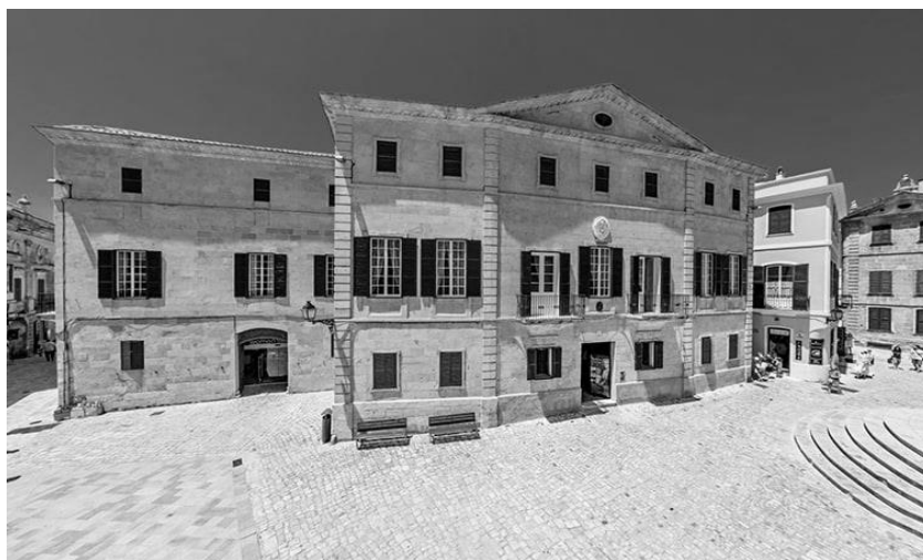
Figura 8. "Palau dels Olives". Autor. Extret de https://www.tartinvillephoto.com/es/visite-virtuelle/palacio-olivar/

El valuós manuscrit es conserva en el palau dels Olives (vegeu figura 8), una de les cases senyorials més emblemàtiques de Ciutadella ubicada en el cor del poble, a la plaça de la Catedral, davant la porta principal de la Seu. Com també altres residències senyorials, es va formar a partir de l'adquisició de cases més petites, ocupa juntament amb el palau del comte de Torre-Saura gairebé tota la illeta entre la Catedral i la plaça del Born. Tot i ser una construcció edificada en el segle XVII, es