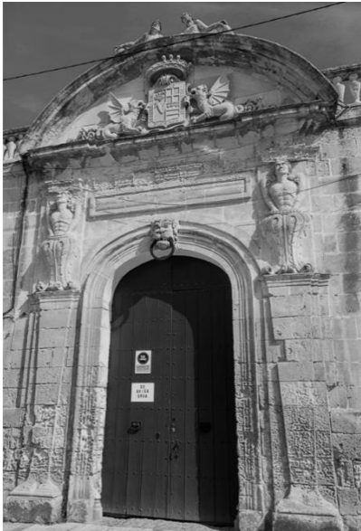
Figura 18. "Portalada pels carruatges del palau Torre-Saura". Autor. Extret de https://menorcaotur.com/menorca/pueblos/ciutadella-de-menorca/palau-torresaura.html

La portada central, d'ordre gegant, es desplega entorn d'un gran portal d'arc carpanell, delimitat per dos estípits que sostenen dos atlants emergint de volutes d'inspiració vegetal. De part damunt discorre un entaulament coronat per un frontó corb, ostentant l'escut comtal sostingut per dos grifos alats d'acurada execució 92 .