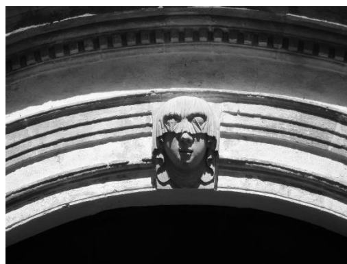
Figura 16. “Rostre petri velat de la porta principal del palau de Torre-Saura”.

La gran arquitectura palatina s’aixecà l’any 1839, essent el més impressionant dels palaus ciutadellencs, tant per les seves grans dimensions -ocupant gairebé tota la llargària del carrer- com per la seva estètica. La porta d’entrada es troba en el carrer Major des Born, davant de la del palau Salort, és de fris circular amb la clau decorada per un rostre petri velat (vegeu figura 16), simbolitzant que com que no veu, deixa passar a tothom, sense tenir preferències “en no veure el qui traspasa el portal, hi deixa entrar a tothom sense fer distincions” 90 . La portalada està emmarcada per