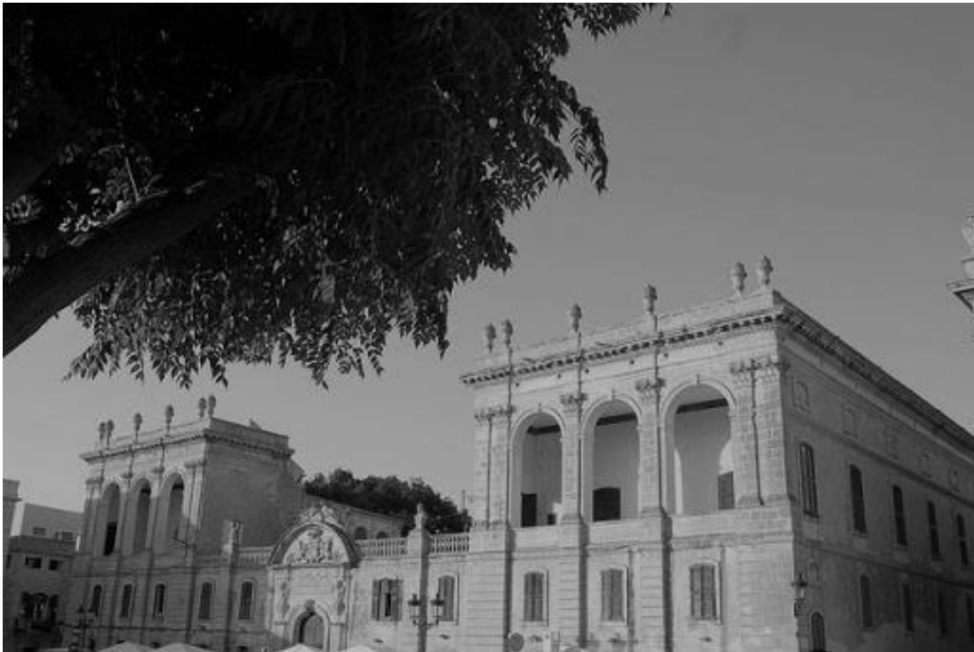
Figura 17. "Palau de Torre-Saura".

Les llotges estan recorregudes per sis pilastres llises entre les quals s'obren tres grans arcs de mig punt, coronades per capitells d'ordre compost[...] amb fris llis i cornisa amb dentellons de part damunt de la qual sobresurt encara un coronat amb sis grans copes amb decoració floral 91 .