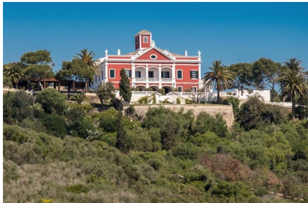
Figura 4. “Golden House o The Nelson's House”. Autor. Extret de https://www.yellowcatamarans.com/en/trip-around-the-port

destaca per una façana vermella que beu clarament dels models palladians, amb una lògia de tres arcs en el cos central coronat per un frontó amb una escultura en posició sedent a banda i banda i coronat per un bust, igual que a cada extrem de la façana. Crida l'atenció una torre de planta que garanteix una millor visió del port. L'interior emmagatzema exquisits mobles de l'època.