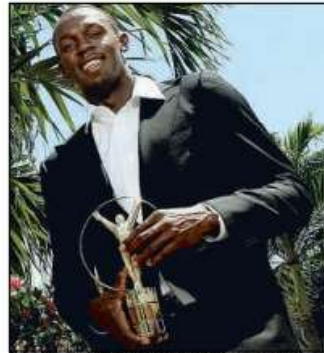
El jamaicano Usain Bolt, mejor deportista masculino