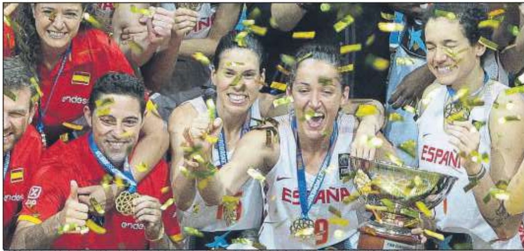
Lara Palomares, la capitana de la selecció española femenina, celebra el títol de campeona de Europa conquistado en el Eurobasket femenino 2017 que se ha disputado en la República Checa.

La selección femenina se proclamó campeona del Eurobasket arrasando a Francia en la final