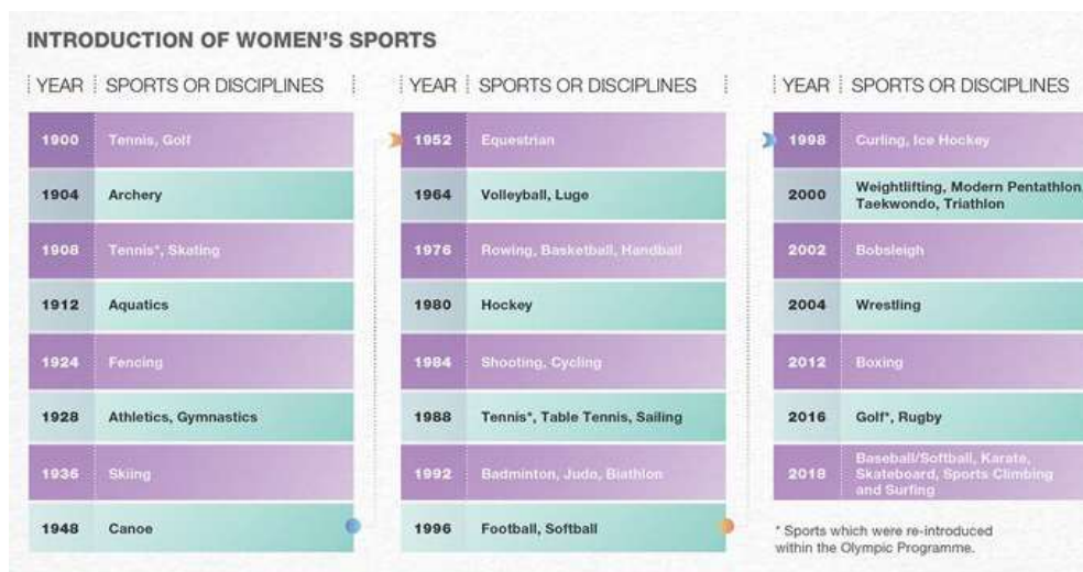
Imatge 2. Font: IOC. Extret de https://www.olympic.org/ioc/

Com podem observar, l'increment de la participació de les dones als Jocs Olímpics ha sigut tant brutal que ha passat d'un 2,2% als primers jocs que es va acceptar la presència de la dona a gairebé la meitat d'esportistes totals amb un 48,8% de dones que, teòricament, haviem de participar en els Jocs de Tokyo el juliol del 2020.