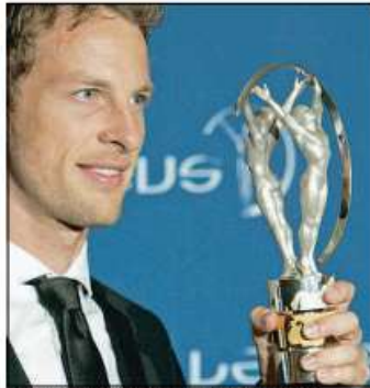
El piloto inglés Jenson Button con su trofeo Laureus