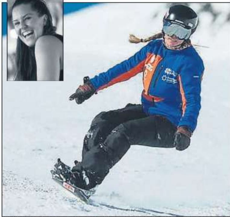
La snowboarder Astrid Fina, una de las cuatro integrantes de la delegación española que luchará por las medallas en PyeongChang.

ra fiat al médico. No le dije nada ni a mi madre. Recuerdo el entrar al quirófano. Fue muy duro, como si me llevaran al matadero".