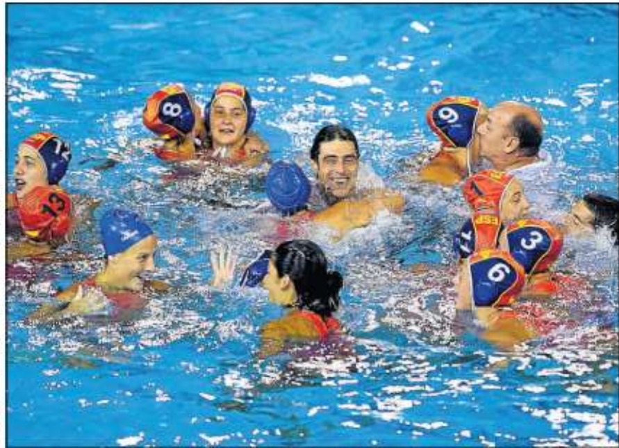
De izquierda a derecha tras la plata del oro: 12 y la selección masculina en la final de Barcelona'92. Las guerreras tienen una raicilla de oro olímpico.