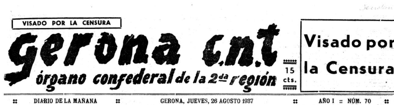
Imatge 1: Capçalera utilitzada des del començament fins el 2 de setembre. Núm 70.

Els canvis que va sofrir el diari són visibles tant a la capçalera, com en el format. Fins a l'1 de setembre es va mantenir de la següent manera: