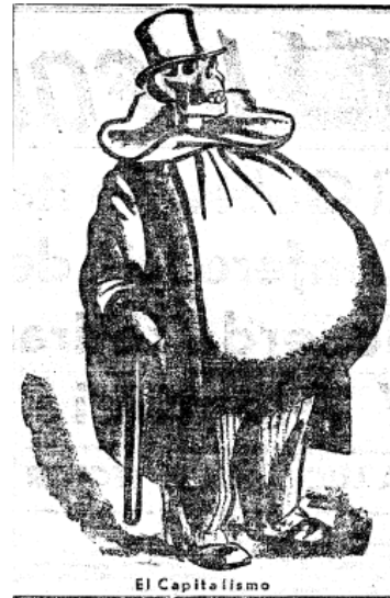
Imatge 5: Caricatura del capitalisme. Publicada el 24 de juny (núm. 16).

Aquests dibuixos o caricatures obeeixen a les condicions de recepció (Pineda et al., 2012). És a dir, els lectors del diari s'imaginen així als capitalistes i als treballadors, i les imatges il·lustren de manera senzilla aquest imaginari i, a més, el reforcen.