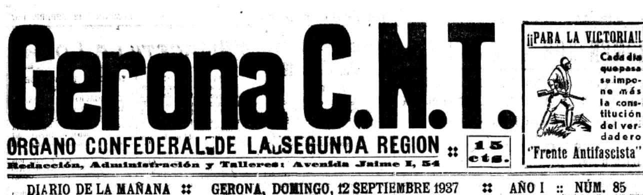
Imatge 2: Segon tipus de capçalera utilitzada. Núm 85.

A partir del 2 de setembre, quan el diari va haver de reduir les mesures i el nombre de columnes, la capçalera va passar a tenir la següent forma, fins al 19 de setembre: