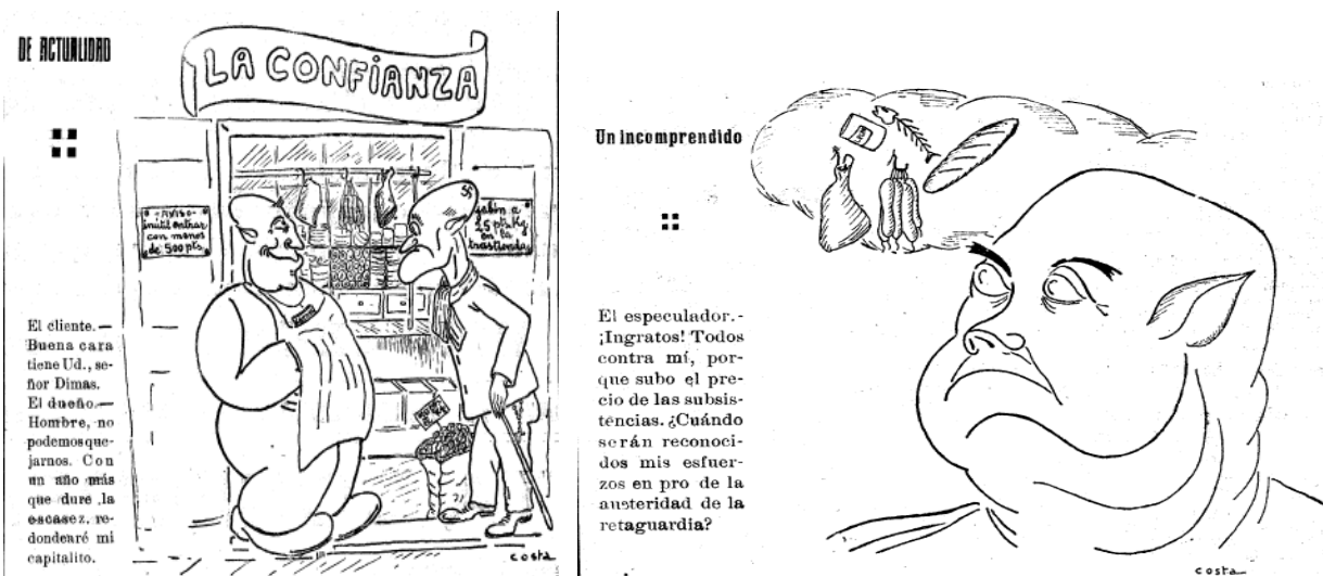
Imatge 8: Caricatura del 14 d'agost (esquerra, núm. 60) i del 4 de setembre (dreta, núm 78). Representen als acaparadors, i estan retratats de la mateixa manera que apareix descrit el personatge de don Chichi

En relació amb els acaparadors que, segons el diari, abasteixen als rics i sacrifiquen al poble treballador (núm. 76), publica, també, algunes caricatures, com la del 14 d'agost i la del 4 de setembre, per exemple: