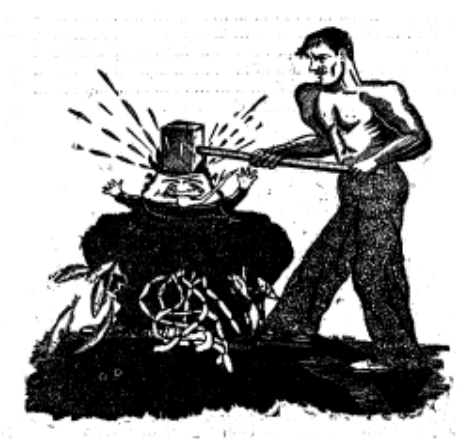
Imatge 4: Caricatura d'un obrer fort aplastant a un acaparador (núm. 16).

vestit amb frac i barret de copa i al qui se li veu el crani. Els ideals llibertaris, en canvi, se'ls sol representar amb imatges de treballadors musculosos i forts.