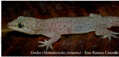
Gecko ( Hemidactylus frenatus ) - Jose Rances Caicedo