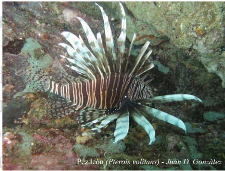
Pez león ( Pterois volitans ) - Juan D. González

Biodiversidad exótica: presencia de especies marinas no-nativas introducidas por el tráfico marítimo en puertos colombianos. Caracterización taxonómica de la población del pez león Pterois volitans en el Caribe colombiano: invasión actual y futura de Colombia: estrategias para el arribo del escarabajo coprófago (Coleoptera: Scarabaeidae) de su establecimiento. Dispersión del cangrejo rojo americano ( Procambarus clarkii ) (Decapoda: Decapoda). Presencia de Lithobates catesbeianus : Ranidae) en Colombia. Quince años de presencia de Hemidactylus frenatus (Fabricius, 1781) y posibles efectos de su introducida por Girard, 1859 en Colombia. Caracterización taxonómica de la población del cangrejo rojo americano ( Procambarus clarkii ) (Decapoda: Decapoda) residente en Colombia. Presencia de Lithobates catesbeianus (Girard, 1859) en Colombia. Caracterización taxonómica de la población del cangrejo rojo americano ( Procambarus clarkii ) (Decapoda: Decapoda) residente en Colombia. Presencia de Lithobates catesbeianus (Girard, 1859) en Colombia. Caracterización taxonómica de la población del cangrejo rojo americano ( Procambarus clarkii ) (Decapoda: Decapoda) residente en Colombia.