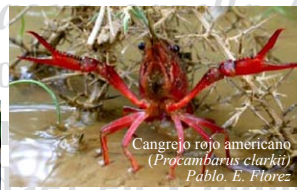
Cangrejo rojo americano ( Procambarus clarkii ) Pablo E. Florez