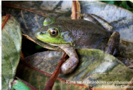
Rana toro ( Lithobates catesbeianus ) Fernando Castro