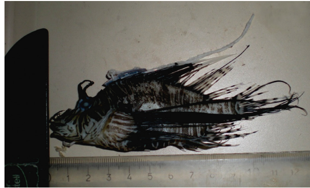
Figura 4. Pez león Pterois volitans , fotografía de colecta.