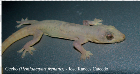
Gecko ( Hemidactylus frenatus ) - Jose Rances Caicedo