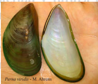
Perna viridis - M. Ahrens