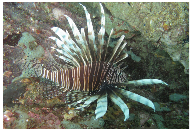
Figura 3. Pez león Pterois volitans , fotografía in situ .

(Punta Betín y El Morro), de Taganga (Playa Grande, Mendihuaca, Sisihuaca, Playa Vaca y Playa de Pescadores); y PNN Tayrona (Granate, El Cantil, La Pecera, Isla de la Aguja, Punta Aguja, Punta del Vigía, Punta Venado, Las Minas, Casacamargo, Olla Tortuga, El Morrito, Bahía Concha, Bahía Chengue, Bahía Gayraca, Playa del Amor, Bahía de Nenguange, Playa del Muerto y Bahía Cinto) (Figura 1). Por estar localizada en una ramificación de las estribaciones del sistema montañoso más alto que existe a la orilla del mar -la Sierra Nevada de Santa Marta-, así como por la existencia de una plataforma continental angosta y los fuertes vientos alisios del noreste, se forman acantilados y numerosas bahías protegidas de diferente tamaño, donde se favorece la concentración de la mayoría de los ambientes litorales del trópico en un área relativamente pequeña (Strewe 2005).