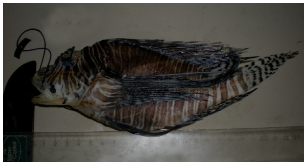
Figura 5. Pez león Pterois volitans , fotografía de colecta.

of Pterois volitans (Pisces: Scorpaenidae) for Cuban waters. Solenodon 7: 37-40.