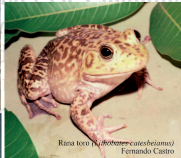
Rana toro ( Lithobates catesbeianus ) Fernando Castro