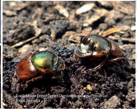
Escarabajo coprófago ( Digitonthopaeus gazella ) Jorge Noriega