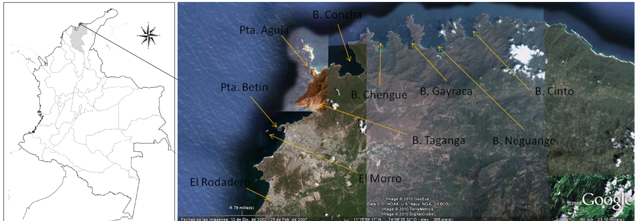
Figura 1. Área de estudio.

pinas venenosas por lo que tienen que ser manejadas con mucho cuidado (Acero 2009). El género Pterois tiene ocho especies que pueden ser diferenciadas por morfometría, merística y coloración (Schultz 1986). Su ámbito natural de distribución va desde el sur de Japón y Korea hasta la costa este de Australia, Indonesia, Micronesia y la Polinesia Francesa en el Pacífico occidental, y desde el oeste de Australia hasta las Islas Marquesas y Oeno en las Islas Pitcairn en el Pacífico sur (Schultz 1986). Pterois volitans es un llamativo y atractivo pez de arrecife. Es muy popular entre los acuaristas y fácilmente reconocible para el público en general por su vistoso ornamento en las aletas dorsales y pectorales con enormes espinas y su pigmentación siguiendo un patrón de rayas blancas y rojizas o negruzcas. Pero por ser peces de acuario populares han sido ampliamente comercializados y ahora se encuentran en casi todo el mundo (Freshwater et al. 2009).