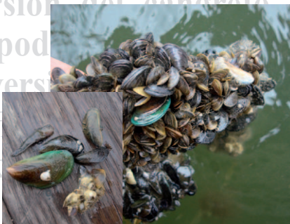
Perna viridis entre otros millones - M. Ahrens