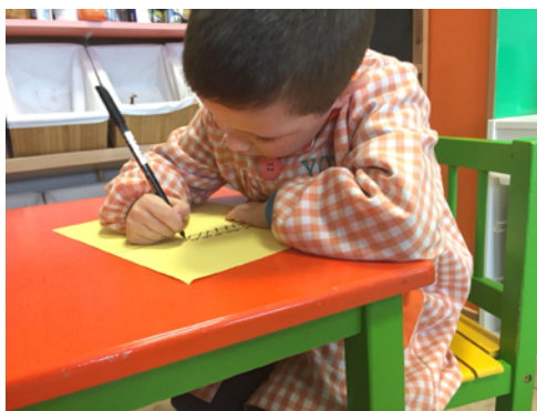
Figura 5. Registrando.

Partiendo de la base que los registros y las representaciones matemáticas de los niños de las primeras edades se ven limitados a dibujos, a un lenguaje matemático reducido, grafías o palabras o a los primeros simbolismos (Alsina, 2016), las producciones de los alumnos se han organizado en 5 grupos: argumentación pictórica; lenguaje matemático; con palabras o grafías; argumentación simbólica; argumentación mixta (tabla 1).