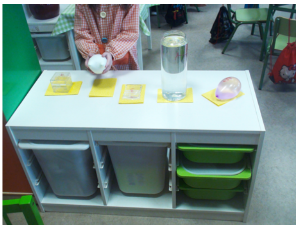
Figura 2. Recipientes.

Se seleccionan 5 recipientes con diferentes formas geométricas: una caja con forma de cubo, un bote con forma de cilindro, un globo que simula una esfera, una bolsa rectangular y un globo con forma de corazón.