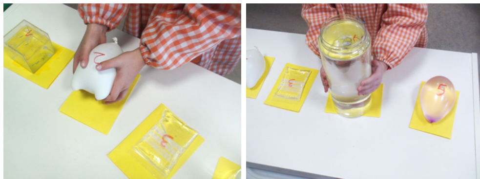
Figuras 3 y 4. Manipulando.