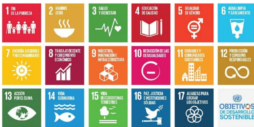
Figura 1. Objetivos de desarrollo sostenible, UNESCO (2017).

En sintonía con la UNESCO, para alcanzar estos objetivos es necesario contar con una educación holística, integradora y transformadora que considere: a) contenidos y los resultados de aprendizaje; b) la pedagogía y entornos de aprendizaje; c) frutos del aprendizaje; y d) transformación social. En definitiva, se trata de un desafío que requiere una evolución de la enseñanza al aprendizaje para educar a las actuales y futuras generaciones en sostenibilidad, con el propósito de “desarrollar competencias que permitan a las personas reflexionar sobre sus propias acciones, teniendo en cuenta sus impactos sociales, culturales, económicos y ambientales actuales y futuros, desde una perspectiva local y global” (UNESCO, 2017, p. 7). De esta manera, se espera que a través de la EDS las generaciones actuales y futuras puedan alcanzar aprendizajes cognitivos, socioemocionales y conductuales específicos, y, sobre todo, desarrollar competencias clave de sostenibilidad, requeridas para contribuir a la comprensión y al logro de cada uno de los desafíos particulares de los ODS (Rieckmann, 2012). Esto trae consigo la necesidad de generar instancias de crecimiento profesional del profesorado que les permitan incorporar competencias clave de sostenibilidad (UNESCO, 2017) y