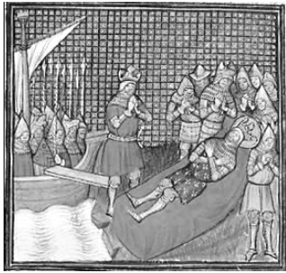
Mort de Lluís IX a Tunis en un manuscrit de les Grandes Chroniques de France , s. XIV (Chantilly, Musée Condé).