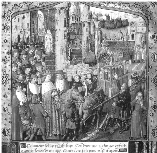
Felip III l'Ardit, rei de França, portant a París el cos del seu pare difunt, sant Lluís.

'Us preguem que procureu que aquesta gent de Castelló, que s'han lliurat a Nós, i dels llogarets del votant, no els faci cap mal ningú, i absolveu-los de tot allò que els obligava envers Nós i que cadascú torni amb el seu senyor'.