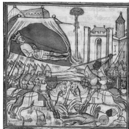
Mort del rei Lluís IX a la batalla de Tunis al 1270 (Paris, BnF, fr. 2606, f. 319v).

Per tant, encara que ni Desclot ni Muntaner fossin presents en els últims moments de vida de Pere el Gran, podien estar-ne més o menys