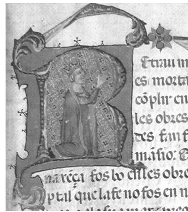
El rei En Jaume pregant poc abans de morir. Caplletra del pròleg del Llibre dels fets del còdex de Poblet de 1343 (Barcelona, Biblioteca Universitària, ms. 1, f. 1r).

De fet, encara que dubto molt que el vell Muntaner hagués pogut arribar mai a llegir sencera el Llibre dels fets , m'atreveixo a dir que podem respirar aquesta «gran alegria» en el pròleg del Llibre dels fets . No sé com s'ho va fer el vell cronista de Peralada, sense haver-lo pogut llegir sencera, per intuir l'alegria que traspua en el pròleg de Jaume I. Potser, però, l'únic que va fer Muntaner és donar forma narrativa als ingredients fonamentals del ceremonial de la «bona mort» vigents a finals de l'Edat Mitjana, i afegir a la seva recreació de la mort d'un rei sant un element tan important com l'alegria.