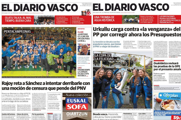
IMAGEN 2 Portadas de El Diario Vasco : izquierda, el Bera Bera; derecha, la Real de hockey.

De esta forma, en las portadas de la prensa regional en 2018 que tuvieron como protagonista en la imagen principal al deporte femenino, sobresalieron figuras como la piloto murciana Ana Carrasco, primera mujer campeona del mundo de motociclismo, con cinco portadas en La Verdad (un par de ellas compartidas con el ciclista Alejandro Valverde); o la atleta granadina María Pérez, cuya imagen copó tres primeras páginas de Ideal tras proclamarse campeona de Europa de 20 kilómetros marcha (Ver IMAGEN 1).