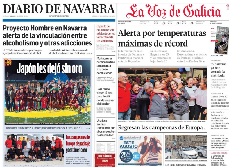
IMAGEN 3 Diario de Navarra (izda.) y La Voz de Galicia (dcha.) destacan a "sus" futbolistas.

Teniendo en cuenta la tendencia antes señalada del tratamiento a veces discriminatorio que recibe la mujer deportista en los medios, es preciso señalar que en casi todas las fotografías de portada con presencia femenina analizadas en la presente investigación, se muestra a las mujeres en relación con alguna actividad deportiva, no hay ningún tipo de connotación sexual en el uso de texto o imágenes y, además, todas las mujeres que aparecen son deportistas.