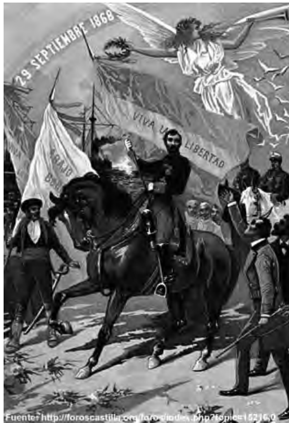
Fig. 3. Batalla d'Alcolea (Còrdova).