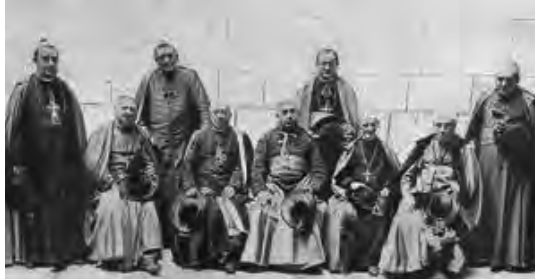
Fig. 6. La jerarquia eclesiàstica espanyola

Volem evidenciar documentalment l'arrel de la problemàtica religiosa en el cas de la població de Castelló d'Empúries 50 , observada per un mateix religiós. En aquesta localitat ja hi havia una part dels habitants poc religiosos però el capellà no entenia l'animadversió que rebia: “(...) La discreción, el pulso, y el conocimiento de las aspiraciones de sus parroquianos, no ha sido la cualidad que más -le- haya adornado, de aquí es que no ha acertado en dirigirles, encaminarlas y corregirlas, al contrario animado de un celo poco reflexivo lo que en su conciencia juzgaba un remedio, los irritaba, juzgaba debía reprender cuando hubiera sido provechoso callar o decirlo de otra forma. ” En aquest cas no s'arribaria a la destitució perquè el consistori no va trobar cap substitut.