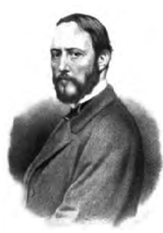
Fig. 5. El ministre de la guerra, el general Joan Prim.

totes les partides que encara estiguessin armades i recollir també tot l'armament no particular. La justificació de Prim era la d'estalviar despeses innecessàries (?). Així va començar el Govern provisional a tancar el procés revolucionari.