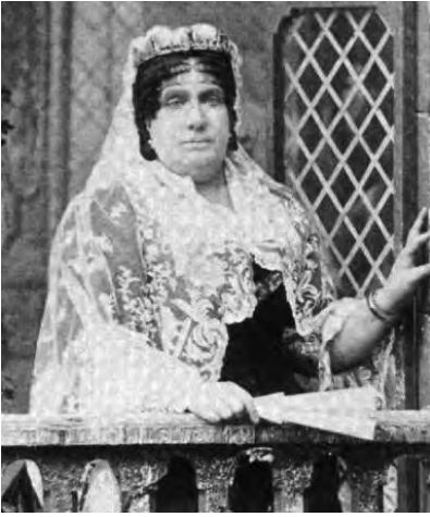
Fig. 1. Isabel II de Borbó.