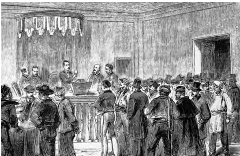
Fig. 4. Proclames i eleccions de les juntes revolucionàries.

autoritats del poble de fet “van assentir” però no fou fins al dos d’octubre que la junta prengué possessió dels nous càrrecs 6 .