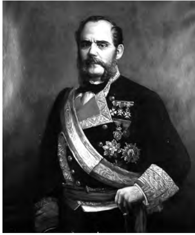
Fig. 2. Almirante Juan Topete.