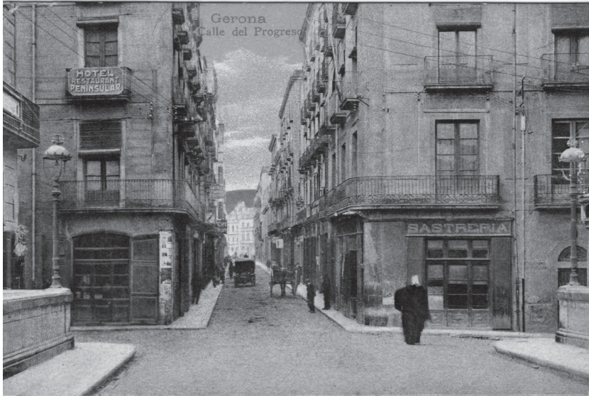
El carrer Nou, dit també del Progrés o d'Isabel II, símbol de la nova Girona del segle XIX.