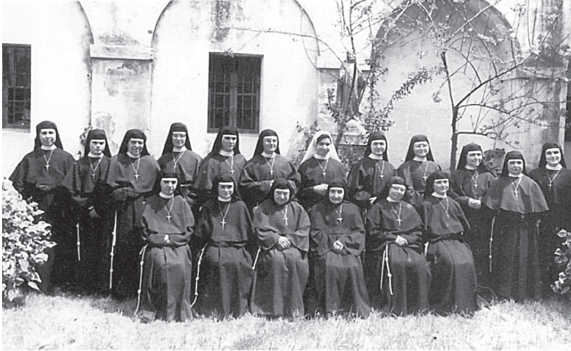
La comunitat de monges clarisses, retratada abans de deixar el convent de Salt.