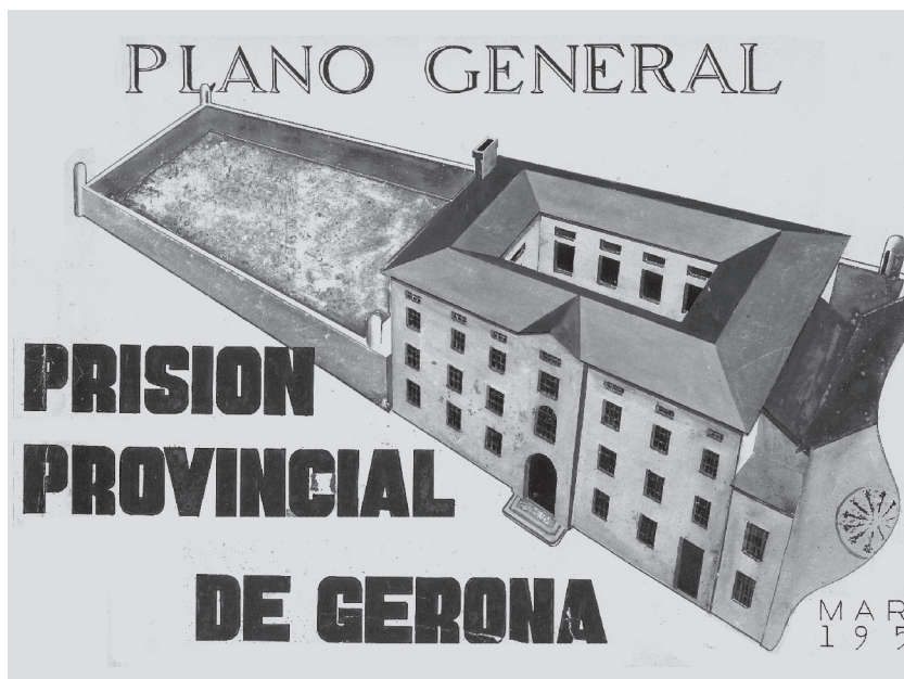
Dibuix de la façana del convent de les clarisses de Salt, convertit, a la postguerra, en Presó Provincial.