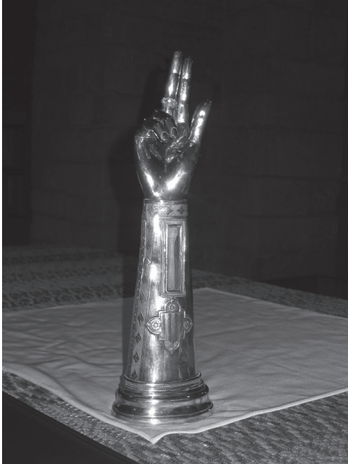
Figura 5. Braç-reliquiari de Sant Daniel.

La decoració del reliquiari és bastant sòbria. Destaca l'ús d'un motiu floral de format romboïdal, inserit en la franja que rodeja la finestreta que mostra el seu contingut, l'os del canell de sant Daniel. Sota l'obertura, un escut assenyala el promotor que va proporcionar la peça al monestir; hi veiem de gules tres pals d'argent. Malgrat no existir una coincidència exacta, s'aprecia una proximitat més que notable amb les armes dels Vilamarí de Girona (de gules quatre pals d'argent) 34 . El reliquiari va poder ser donat per qualsevol membre de la família Vilamarí, però en el cas hipotètic que es tractés de la mateixa Ermessenda, s'hauria de situar l'obra entre els anys 1421 i 1431, període durant el qual ella regí el monestir, o fins i tot abans, tenint com a referència la donació que va efectuar el 1410 essent encara una simple monja. En qualsevol cas, aquestes dades ens permeten perfilar una nova i important figura dins del camp de la promoció artística en el gòtic gironí, pel que sembla centrada específicament en el monestir de Sant Daniel.