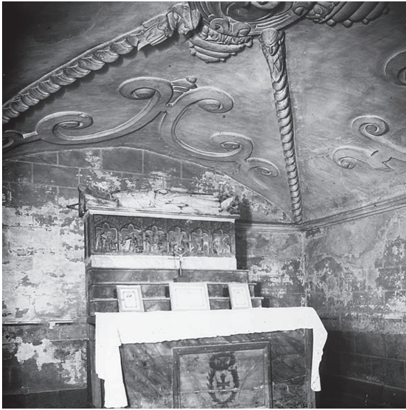
Figura 1. Cripta de Sant Daniel.

Una de les fonts que, a priori , poden ser més interessants per conèixer la presència iconogràfica de sant Daniel en el monestir i la situació del seu sepulcre –amb tot el mobiliari litúrgic que l’acompanyava– són les visites pastorals. Les dels segles XIV i XV solen ser bastant remises a l’hora de proporcionar-nos informacions sobre els retaules i tresors del monestir. Amb tot, comptem amb una digna excepció en la visita efectuada l’any 1474 8 . En aquesta es fa esment de l’advocació de l’altar major, dedicat a Sant Salvador, raó per la qual cal descartar la presència d’un retaule dedicat a sant Daniel en aquest espai. La visita és bastant detallista pel que fa als retaules i a les imatges, i concreta la presència dels primers en tots els altars de l’església (Santa Maria, sants Sadurn i Egidi, Santa Margarida, Sant Gabriel, i Sant Benet al cor). A més, es precisa l’existència d’una estàtua mariana de fusta en un angle de l’altar de Santa Maria, així com un petit retaule que es guardava a l’interior d’una caixa a l’altar de Sant Gabriel, que presentava la imatge de la Verge amb dos àngels, flanquejada per sant Antoni i san Egidi.