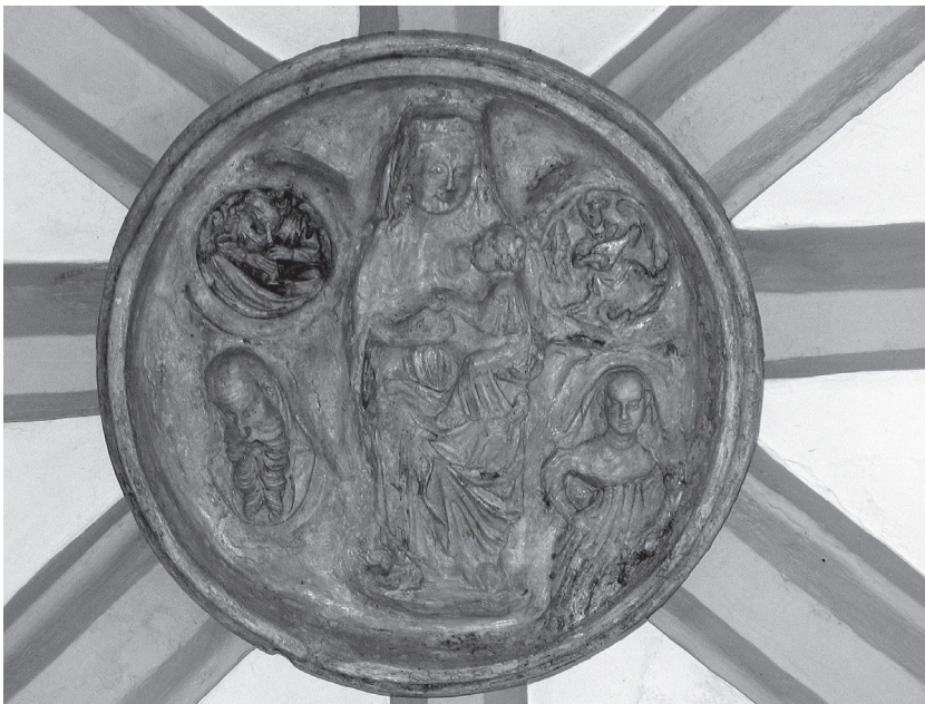
Figura 4. Clau de volta del claustre superior de Sant Daniel.