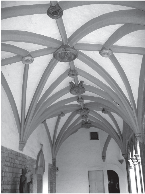
Figura 3. Voltes del claustre superior de Sant Daniel).