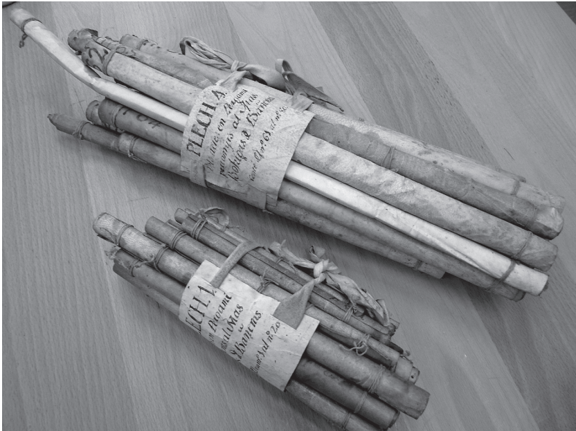
Dos plecs dels actes en pergamí del mas Bohigues de Banyeres del fons Teixidor de Madremanya (AHG, Teixidor de Madremanya, pergamins del mas Bohigues de Banyeres).

Una estructura que, per alta banda, encara podem trobar en alguns arxius patrimonials de masos, com el fons patrimonial Teixidor de Madremanya, ingressat a l'Arxiu Històric de Girona a finals del 2012: