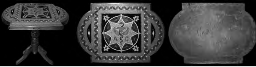
Figura 3: Tauleta de farmàcia de l'època isabelina de la ditada en fusta de cirerer i sobre de terratzo. Realitzada amb morter de pòrtland, pedra artificial matxucada i marqueteria de roca natural, signada a sota M. Carlos Butsems 1888.