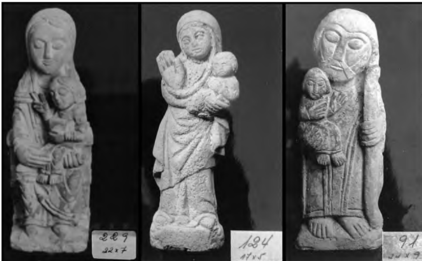
Figura 5. Tres exemples de figures religioses decoratives de l'inventari de "Arte Ibérico S. A.", amb el número de referència i les mides.