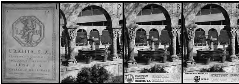
Figura 4: D'esquerra a dreta, catàlegs de diferents empreses dedicades a reproduir peces d'art en pedra artificial. El 1 (Lena S. A.) mostrant un dels seus catàlegs (el 1A); el 2 (Arte Ibérico S. A.); el 3 (Decoración en piedra Marqués S. A.) i el 4 (Ceràmica Vulpellach, S. L.).