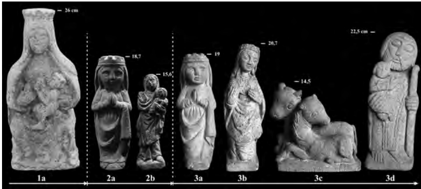
Figura 1. Ordre d'aparició de les petites escultures amb les seves alçades guardant les proporcions. La 1ª va entrar en el Museu Arqueològic Comarcal de Banyoles a l'any 1954 i mai se li ha practicat cap prova de laboratori; la, 2a va anar a les mans del signant d'aquest article el dia 10 de gener de 2013 i la 2b unes hores més tard; i finalment de la 3a-3d van aparèixer el 13 de gener de 2015 a Girona a casa del col·leccionista i magistrat Sr. Miquel Pérez Capella.

pessebristes consultades (la de Catalunya, la de Banyoles, ...) mai hagués vist una escultura d'aquest tipus.