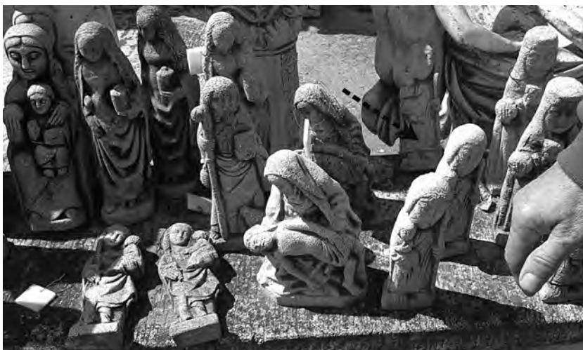
Figura 2. En primer pla escultures semblants a les del article i una d'igual (la marcada amb una fletxa negra) a les que s'observen a la figura 1 (3d).

en "pedra", ja sigui fetes per italians o altres. Al cap de poc temps van arribar als Països Catalans encapçalats per Barcelona 5 i va ser la capital la que hi va jugar un paper més important. Deixant la construcció de banda, a finals del segle XIX a Barcelona ja trobem grans firmes com Mariano Carlos Butsems Just (Barcelona, 1846-1902) conegut a nivell nacional i internacional en l'elaboració de mosaics (figura 3). Ja abans d'esclatar la Guerra Civil Espanyola (1936) es poden trobar les primeres empreses catalanes dedicades a la reproducció d'obres d'art (figura 4), per exemple "Lena, S.A". 6 Aquesta firma comercial sembla que va publicar el seu primer catàleg a l'any 1900 7 . Després de la Guerra Civil tothom coneix també la qualitat de les primeres reproduccions d'art de la població vallesana de Sant Cugat.