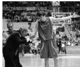
Pesic i Focka.

Trenta-set minuts són els que va trigar Svetislav Pesic a presentar-se a la roda de premsa posterior al partit. Al vesíder hi havia hagut serrieda, perquè a ningú se li escapa que perdre per tancar cop seguit a casa no és una situació normal. Davant dels mitjans, Pesic tampoc va fer una roda de premsa normal. Va trobar moments per lluir el riall—va qui hem de felicitar perquè ha fet un partit esplendí. Ens ha donat una liçó—, però en general va parlar de l'Akasvayu, agafant la distància d'alt com un punt de partida (o d'arribada) per parlar de la temporada i de la que per ell és la realitat de l'equip.