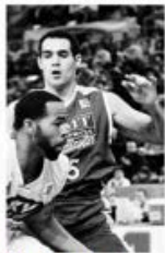
Iturbe defensa Gaias.