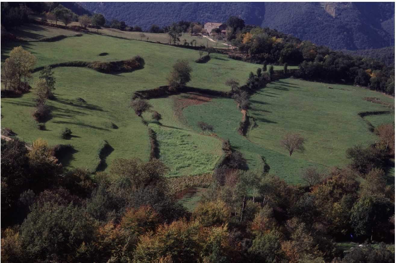
>> Vall de Riu, Montagut i Oix.

La Garrotxa té el 3,9 % de les segones residències de la demarcació i hi destina un 20 % del total del seu habitatge. Cap municipi té més habitatges secundaris que principals. En nombres cal significar Sant Feliu de Pallerols (més de 200), la Vall de Bianya, San-