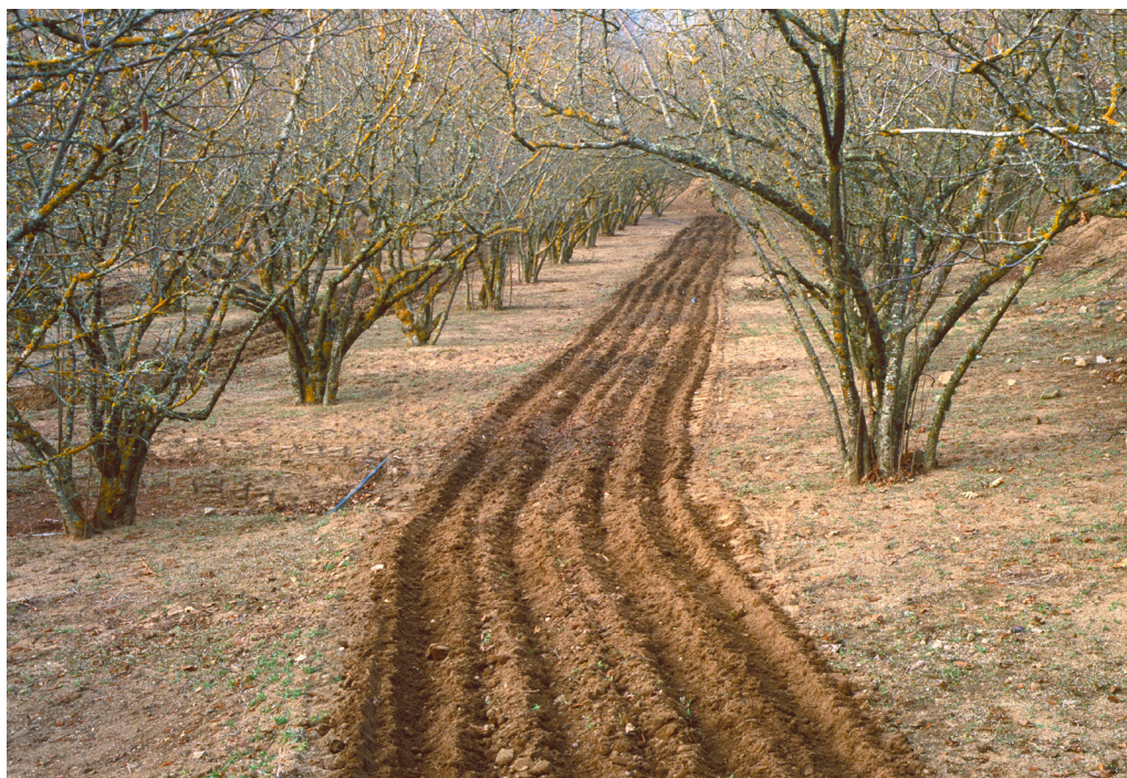
>> Camp d'avellaners llaurat.

De ben segur que l'economia (i també les dinàmiques socials i culturals) dels pobles rurals es veu afavorida per la implantació de segones residències i de noves tipologies d'allotjaments turístics, que ajuden a mantenir vives diferents activitats econòmiques de proximitat (professions, botigues, restauració, producte local...). Ara, la pregunta clau és: Poden els joves locals accedir a la compra d'habitatge als pobles rurals gironins? La tendència a implantar segones residències o a transformar les primeres en segones o en allotjaments d'ús turístic facilita la permanència o el retorn de població? Facilita l'arribada i l'assentament de noves poblacions joves foranes? No hi ha dubte que en l'agenda política del desenvolupament rural cal valorar bé els pros i els contres de les activitats vinculades a totes les tipologies d'allotjaments turístics, no sigui que les noves funcionalitats facin perdre la funció bàsica del món rural: la gestió del territori, la necessària conservació dels mosaics agroforestals.