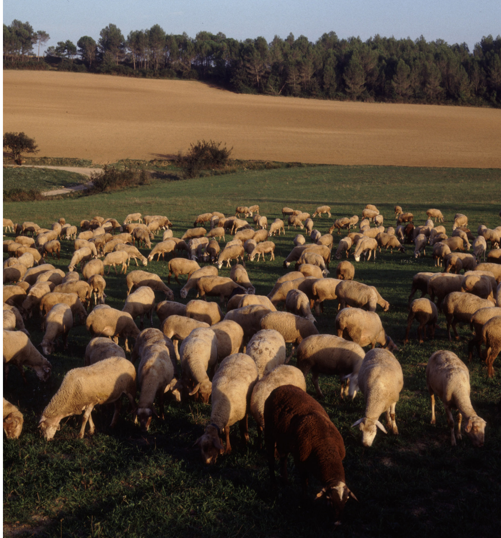
>> Xais a Fontcoberta (Pla de l'Estany).

Segons el cens d'habitatges del 2011 (el darrer cens d'habitatges disponible), als pobles rurals de menys de 2.500 habitants, el 34,8 % de l'habitatge és de segona residència. La Cerdanya n'és la primera concentració, i acull el 31 % dels habitatges d'aquesta tipologia als municipis rurals. El 73,5 % del seu parc d'habitatges és de segona residència, i a 6 municipis el percentatge sobrepasa el 75 %. Alp, a molta distància, i Llivia són en termes absoluts i relatius els de més concentració. Ambdós són els de màxima concentració a les comarques de Girona. De manera modesta, de moment, s'observa la presència de noves modalitats d'allotjaments turístics, i és Alp el que té el nombre més important d'habitatges (159) i apartaments (62) turístics. El Ripollès té el 20 % de les segones residències i, també, el seu parc supera el nombre de residències principals. A tots els pobles el parc de segona residència és el 50 % o més de tot el parc d'habitatges. A Planols, Setcases, Queralbs, Vilallonga del Ter i Llanars les segones residències signifiquen més del 70 %. Per nombre d'habitatges, Camprodon és el tercer municipi de les comarques de Girona amb més segones residències. Al Ripollès hi ha una important presència d'allotjaments turístics (240) repartits entre Camprodon, Ribes de Freser, Vilallonga del Ripollès, Setcases o Queralbs, i de residències cases de pagès