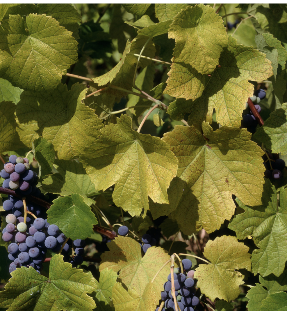
>> Ceps i raïms de Sant Martí de Llèmena.

El Pla de l'Estany, quant a les dinàmiques demogràfiques i econòmiques, presenta moltes similituds amb les planes de la Selva i el Gironès. Entre