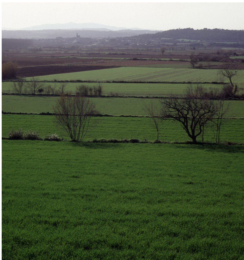
>> Sant Iscle d'Empordà, a Serra de Daró.

lafrugell i Palamós) només dos municipis tenen menys de 2.500 habitants: Mont-ras i Vall-llobrega. El conjunt de municipis rurals acullen 15.433 habitants, un augment de 2.477 persones entre els anys 2000 i 2017. Els guanyos de població més importants, en nombres absoluts, han estat a Vall-llobrega (547), a Ullà (324) i a Cruïlles (200), tot i que en aquest darrer sembla haver-se estancat. En aquests disset anys han perdut població 6 pobles i, atenent a les dades, 11 municipis van perdre població a partir de 2007. La tendència sembla apuntar cap a una lleugera regressió o estancament. El municipi amb una pèrdua més alta de població en nombres absoluts ha estat Mont-ras (- 134). El conjunt d'aquests pobles empordanesos tenen empadronades 1.975 persones d'origen estranger (14 % del total). La seva presència és important al municipi d'Ullà (382, el 33,7 %