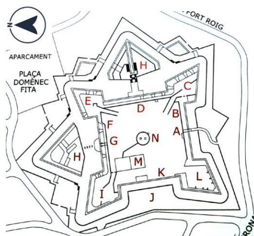
Figura 1 : Plànol del castell de Montjuïc. Dibuix de Jordi Pericot. Font: www.pedresdegirona.com

El castell de Montjuïc, situat en un espai de més de cinc hectàrees, està conformat al voltant d'una planta quadrada. Aquesta, queda envoltada per quatre baluards (E: Baluard de Saint Germain, C: Baluard d'en Pacheco, I: Baluard de Sant Narcís, L: Baluard d'Ozona) que delimiten el recinte de la fortificació connectats per cortines 12 (K) d'una longitud de cent cinquanta metres cada una, de les quals dues (nord i est) anaven cobertes per revellins 13 o llunetes (H), intentant protegir així les cortines,