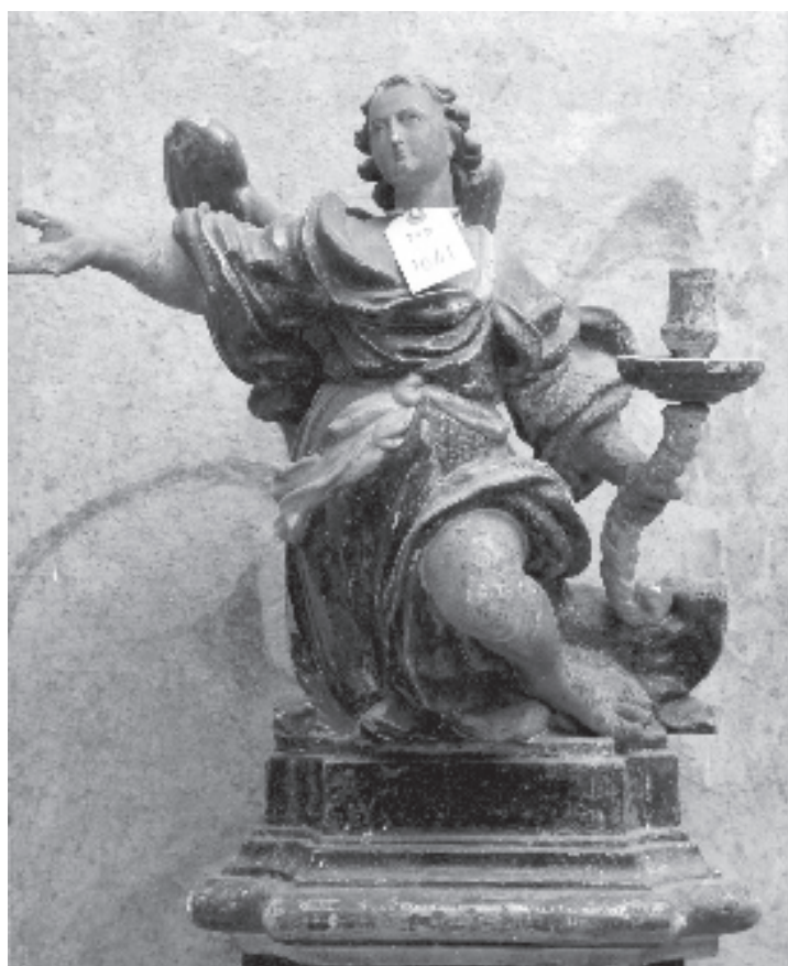
Figura 3. Àngel (MD1041).

12. J. BOSCH, op.cit., assenyala com a característics de Josep Generes els «rostres arrodonits, d'ulls petits i nassos curts i recetes, de cabells de caiguda en blens simètrics», p. 196 i 202.