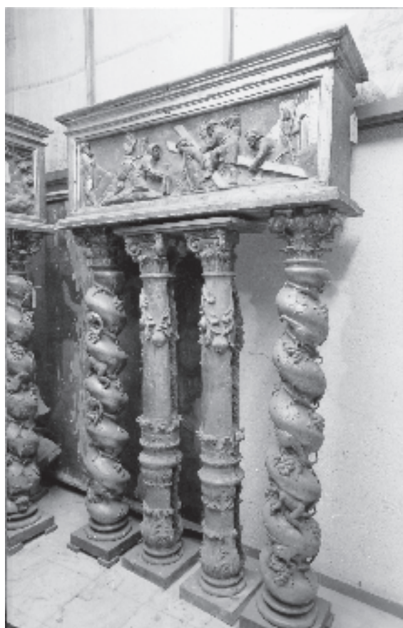
Figura 5. Crist amb la Verònica (MD1043).

fineix com «Architector Gerunda», renova el nomenament anterior i el fa extensiu a tots els litigis que l'artista pugui tenir 15 .