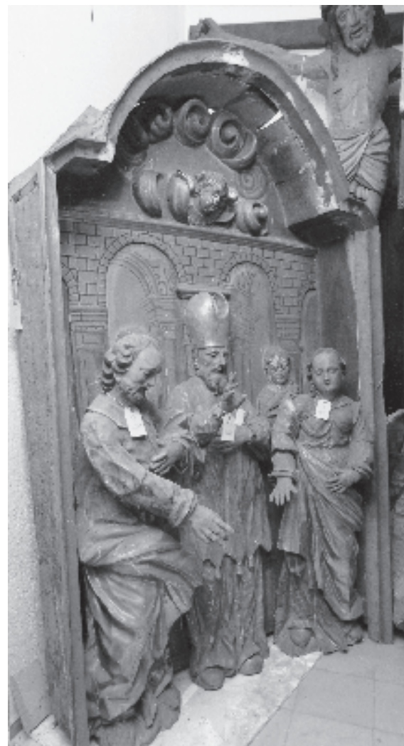
Figura 1. Matrimoni de la Verge (MD1048-MD1051).

L'execució de les figures (de proporcions correctes, rostres delicats, vestits de plecs amplis, detallisme decoratiu) revela un escultor de bon ofici i tècnica acurada, encara que amb dificultats per resoldre els problemes compositius; a més de l'amuntament dels personatges, apareixen dissonàncies en l'escala de les figures.