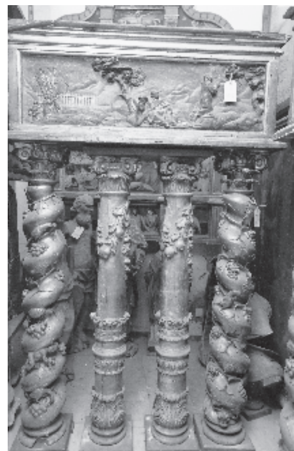
Figura 4. Oració a l'Hort (MD1042).