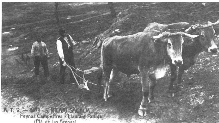
A. T. V. — 4073 - S. HILARI SACALM Feynas Campesines - Llauredí Pausa (Plà de las Arenas)

La principal conclusió que es pot extreure de l'anàlisi de les compra-vendes de terres és el gran poder d'atracció de capitals que la terra continuava tenint a la Selva almenys fins a mitjan segle XIX. Com remarca Rosa Congost, si bé sovint la compra de terres era poc rendible en termes econòmics, continuava essent una forma segura d'inversió i podia resultar «rendible» en termes de prestigi social. La constatació que els comerciants de la costa, especialment a partir de 1815, representen un grup important entre els compradors de terres, tant a altres particulars com de béns desamortitzats, no és un signe de modernització de l'agricultura com han suggerit algunes interpretacions, assen-