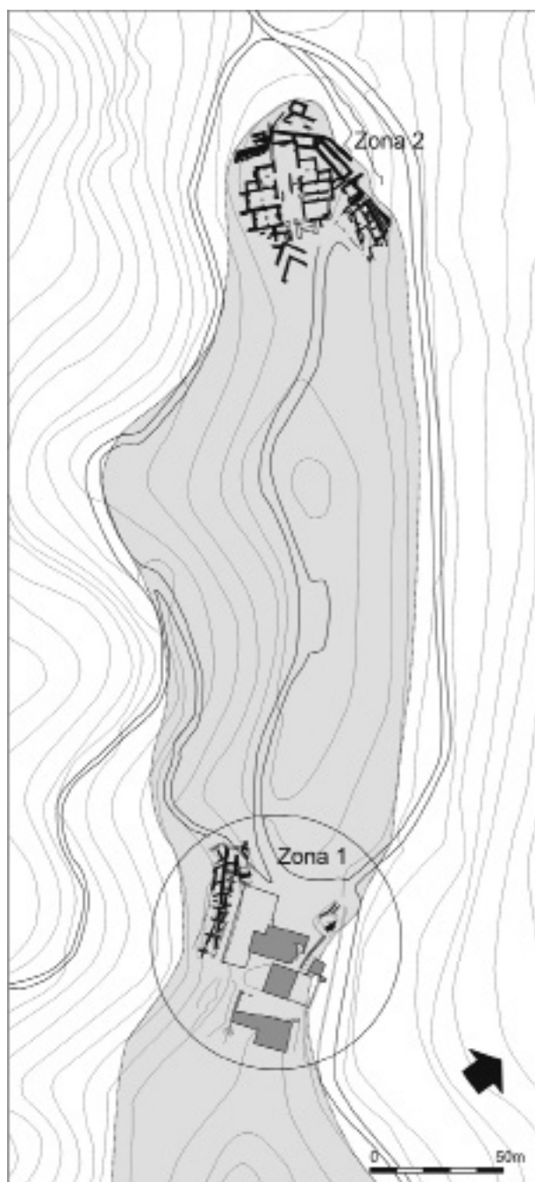
Figura 1. Planta general del poblat ibèric de la muntanya de Sant Julià de Ramis, amb indicació de les dues zones excavades fins ara.

La configuració moderna del cementiri marcava dos àmbits perfectament delimitats pels nivells de circulació i els murs perimetrals contra els quals es van anar recolzant nínxols d'obra a partir de la dècada dels anys 40 del segle XX. El primer, més enlairat, contenia la meitat nord. És un espai quasi quadrat ubicat al