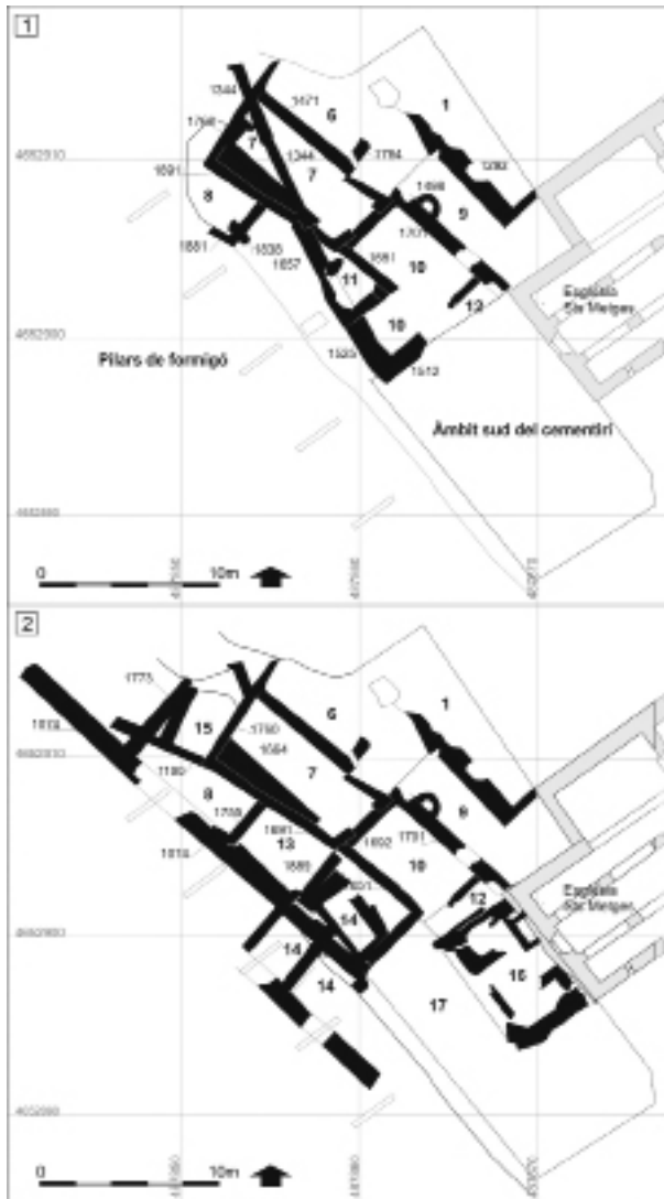
Figura 4. Planta esquemàtica dels àmbits identificats a l'antic cementiri parroquial a les fases més reculades. 1: Àmbits 6 a 12; 2: Àmbits 6 a 17.

nord de l'església i la de ponent de la capella del Roser, la roca natural aflorava just a sota del nivell superficial. Mostrava una superfície planera, regularitzada d'antic, i un retall vertical a ponent. Durant l'alta edat mitjana s'hi van excavar tombes, majoritàriament antropomorfes; aquelles que eren fetes parcialment o total d'obra s'obrien a la UE 1982 que, al seu torn, es disposava sobre la roca natural.