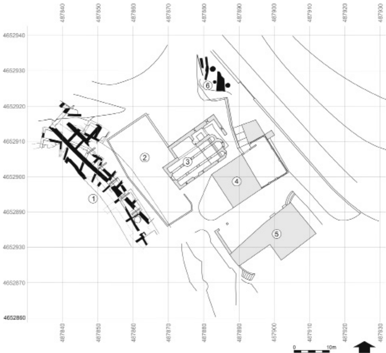
Figura 2. Planta de la zona 1: 1. Esplanada i marge sota el cementiri vell (espai excavat entre 1996 i 1998); 2. Cementiri vell (espai en curs d'excavació des de 2011); 3. Església dels Sants Metges; 4. Can Bota; 5. Antiga rectoria; 6. Jardí de can Bota (sector 17, excavat l'any 2009).

nord-oest de l'església. El segon o àmbit sud conformava una peça rectangular emplaçada a ponent i sud-oest del temple.