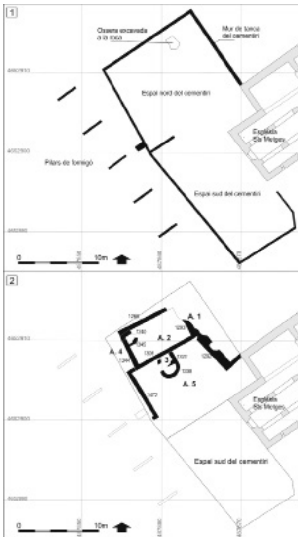
Figura 3. Planta esquemàtica dels espais i àmbits identificats a l'antic cementiri parroquial a les fases més recents. 1: Recinte del cementiri de finals del segle XIX i divisions internes; 2: Àmbits 1 a 5.

res palesen que els àmbits 2 i 3 havien format una unitat, però les evidències recuperades no permeten interpretar-ne la funció.