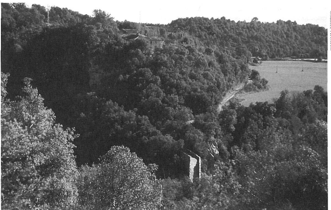
Pont del Llerca, Bauma del Serrat del Pont, casa del Serrat del Pont, camí ramader, alzinar, camp de conreu...

cantelluda i sollevadissa, i escalant espadats i xaragalls, furgava i recociava coves i tutes perdudes entre la malessa, en busca de records i relíquies de llurs passats habitants». En el fulletó Per la promoció del parc natural de l'Alta Garrotxa , editat el 1977, que conté un text de Ramon Sala, s'hi pot llegir: «Per la quantitat de jaciments prehistòrics que trobem en les gorges i abismes de l'Alta Garrotxa, podem considerar-la com un arxiu del nostre passat més remot». Tot i que es tracta d'una percepció generalitzada, fins a la dècada dels anys 80 l'interès arqueològic de la zona no ha estat realment contrastat a partir de programes sistemàtics de recerca.