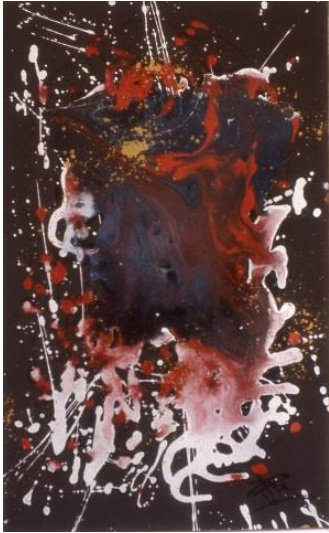
Fig. 2. Josep Maria Compte, Vivacitat , 1979 Esmalt sobre paper, 50 x 32,5 cm

l'expressió -que es fa patent a través dels colors emprats, amb aquesta barreja de blanc, groc i, sobretot, vermell i blau- i no tant el resultat final.