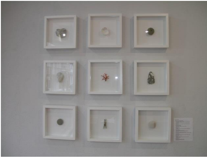
Fig. 14. Josep Maria Compte, Formes i textures , 2015. Diferents materials, 9 quadres de 25 x 25 cm

Així doncs, ens aquestes imatges veiem objectes molt variats, des de corals de mar fins a petxines, pedres o un tros de gespa. Probablement, quan un visualitza tots aquests objectes no li provoquen cap mena de reacció o interès especial, ja que a simple vista pot semblar veure elements naturals que no suggereixen res, però el cert és que darrera d'ells hi ha amagats missatges ocults per a l'espectador.