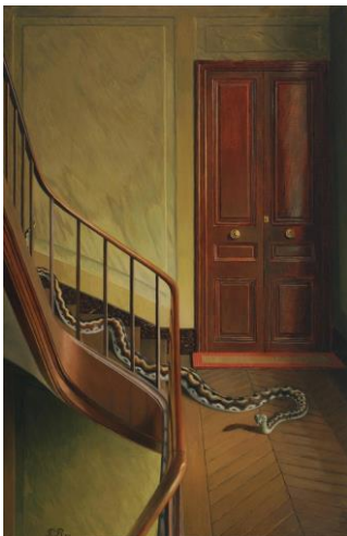
Fig. 4. Pierre Roy, Danger on the Stair , 1927 o 1928 Oli sobre llenç, 91.4 cm x 60 cm The Museum of Modern Art (MoMA), New York

En canvi, la presència d'una serp a l'escala d'una casa d'apartaments en un quadre del francès Pierre Roy (fig. 4.), és totalment inesperada, improbable, però no impossible. El realisme màgic descobreix l'element màgic en la vida sense deformat-la, mentre que el surrealista s'entrega molt més a les deformacions oníriques.