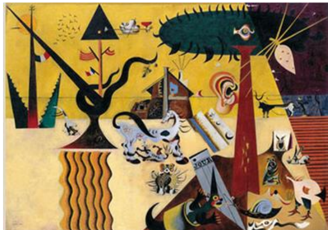
Fig. 17. Joan Miró, Terra Llaurada , 1923-1924 Oli sobre llenç, 66 x 97,2 cm Guggenheim Museum, Nova York