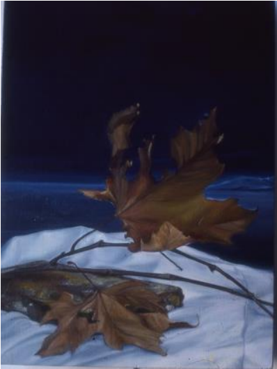
Fig. 6. Josep Maria Compte, Fulles seques de plataner , 1982 Oli sobre fusta, 33 x 24 cm

O bé aquestes Fulles seques de plataner , que Compte ha perfilat en un fons de color blau que evoca el mar. Així doncs, el que ha fet l'artista aquí és introduir un element que resulta força improbable trobar al mar; les fulles, creant un efecte estrany però que al mateix temps esdevé meravellós, fantàstic.