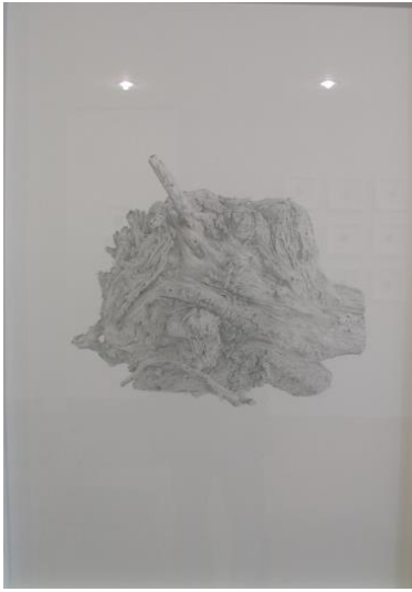
Fig. 16. Josep Maria Compte, Arrel de figuera , 2014 Llapis de grafit sobre paper, 100 x 70 cm

Umberto Eco (el pensador capaç de compensar la manca d'originalitat amb astúcia i intel·ligència), sempre va tenir clar que és la matèria qui pensa; un pensar vehiculat en la figura de l'autor. Compte ha estudiat amorosament la seva matèria, l'ha examinat a fons, ha espiat el seu comportant i les seves reaccions i li ha introduït un discurs, de manera que el resultat final és aquesta evocació a l'emblemàtica obra de Laocont i els seus fills .