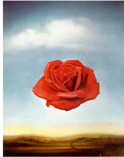
Fig. 12. Salvador Dalí, Rosa meditativa , 1958 Oli sobre cartró pedra, 36 x 28 cm Fundació Gala-Salvador Dalí (Figueres)

Una de les obres més interessants d'aquesta etapa mística de Compte és Homenatge a Dalí , també anomenada Rosa i Montgrí . Compte, amb un paisatge de dalinià horitzó baix, ret homenatge a la ingràvida 18 Rosa meditativa de Dalí. Una atmosfera diàfana i un acurat "trompe l'oeil" s'aproximen al llenguatge oníric dels surrealistes: el setrill d'oli amb la rosa, una combinació d'objectes insòlits només possible en els somnis.