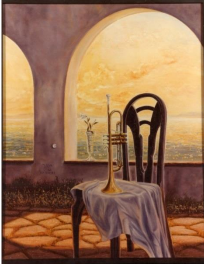
Fig. 5. Josep Maria Compte, Lliçó de trompeta , 1983 Oli sobre fusta, 100 x 81 cm

Les pintures que realitza Compte durant aquest període presenten certament una atmosfera realista màgica: incorporen un realisme que va més enllà del realisme comú; es respira alguna cosa més, alguna cosa diferent.