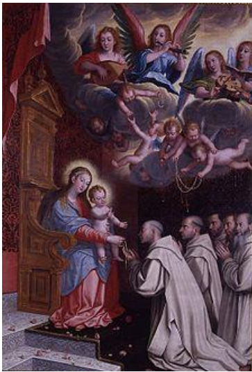
Fig. 9. Juan Sánchez Cotán, Aparició de la Verge a Sant Bruno , 1603-1627 Oli sobre llenç, 372,50 cm x 271,50 cm Museo de Bellas Artes de Granada

En la part dels bodegons s'hi concentra la màxima bellesa de la seva obra i és on s'estableix tota la seva força mística. Composats de forma serena, escrupolosa i quasi matemàtica, Cotán aconsegueix dotar tots aquests bodegons d'un ritme musical, on es representa l'austeritat d'elements com cols, cardos o pomes. Les obres tenen també una rigorosa distribució de volums i ombres i, de tot plegat, en resulta una significació transcendent que Sánchez Cotán confereix als senzills elements de la realitat quotidiana. Juan Sánchez Cotán és la clau d'entrada del que s'ha anomenat segle d'Or -XVII- de la pintura espanyola. No obstant, moltes de les pintures d'aquest místic universal han anat