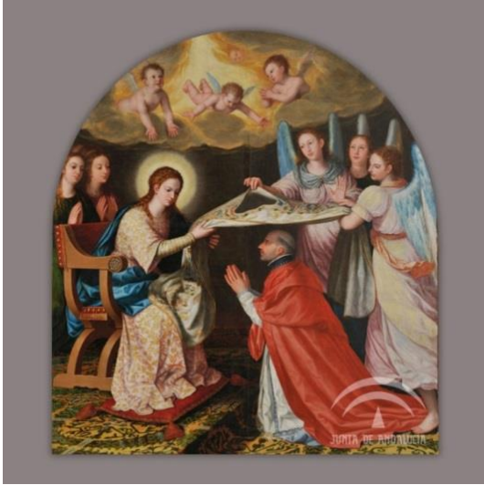
Fig. 8. Juan Sánchez Cotán, Imposició de la casulla a san Ildefons , 1618-1625 Oli sobre llenç, 234 cm x 212,5 cm Museo de Bellas Artes de Granada