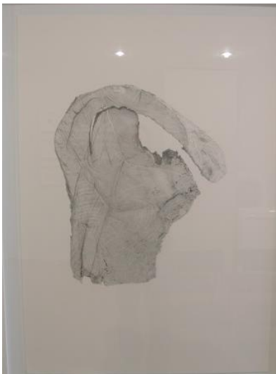
Fig. 15. Josep Maria Compte, Soca de plataner , 2015 Llapis de grafit sobre paper, 100 c 70 cm

Així doncs, ens aquestes imatges veiem objectes molt variats, des de corals de mar fins a petxines, pedres o un tros de gespa. Probablement, quan un visualitza tots aquests objectes no li provoquen cap mena de reacció o interès especial, ja que a simple vista pot semblar veure elements naturals que no suggereixen res, però el cert és que darrera d'ells hi ha amagats missatges ocults per a l'espectador.