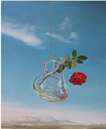
Fig. 11. Josep Maria Compte, Homenatge a Dalí , 2004 Oli sobre tela, 46 x 28 cm