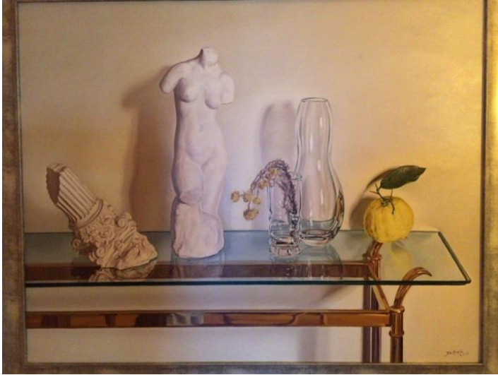
Fig. 13. Josep Maria Compte, Bust femení amb taula de vidre , 2008 Oli sobre tela, 73 x 92 cm

Aquesta pintura, com gran part de les obres de Compte, presenta una sèrie d'elements meticulosament pintats en una taula de vidre. Destaca tot el conjunt d'elements que hi ha: el bust femení i el capitell romà, motius visuals recuperats del món antic i que l'artista ha decidit incorporar en la peça, d'una banda; i, de l'altra, la planta col·locada en el got de vidre, que s'anomena sempreviva 19 i la naronja 20 . Aquí l'artista ha representat el bust sense cap ni braços, de la mateixa manera que la columna clàssica està inacabada; però, precisament, aquesta idea intencionada de deixar elements incomplets o imperfectes no deixa de tenir un atractiu visual i una elegant i complexa composició, capaç de donar una bellesa absoluta a la peça i fer que tot es configuri al voltant d'aquesta figura clàssica.