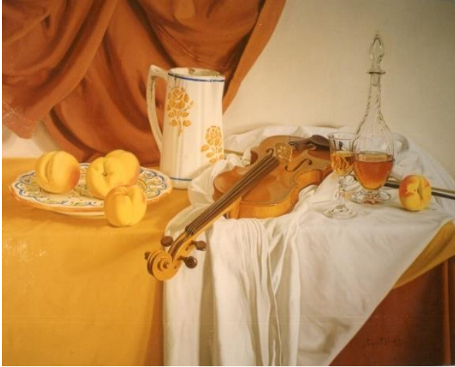
Fig. 7. Josep Maria Compte, Violí i Préssecs , 1997 Oli sobre tela, 73 x 100 cm

Cal dir que d'aquesta etapa artística no es conserva pràcticament res de la seva obra, perquè la ven tota a col·leccionistes privats. Són uns anys en els que, arrel de la primera exposició realitzada a Figueres amb només disset anys, Compte va tenint clientela. Cal tenir en compte que Figueres és una ciutat comercial que gràcies a Dalí la gent comença a entendre que les obres es compren i comencen a entendre també el concepte d'apreciar les obres d'art i gaudir-ne. D'aquesta manera, Compte, a partir de la seva primera exposició, ven un conjunt d'obres que fa que d'aquest període se'n conservi ben poca cosa: les pintures més valuoses són venudes, així com gairebé gran part dels seus dibuixos.