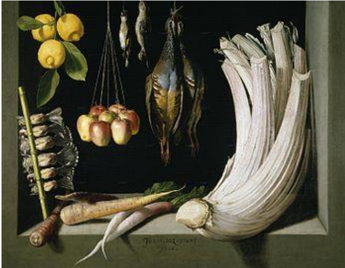
Fig. 10. Juan Sánchez Cotán, Bodegó de caça, hortalisses i fruites , 1602 Oli sobre llenç, 68 cm x 88,2 cm Museu del Prado, Madrid

a parlar a les millors col·leccions dels museus dels Estats Units; i això fa que, potser, a nivell europeu la seva figura hagi passat una mica desapercebuda.