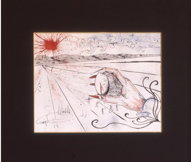
Fig. 1. Josep Maria Compte, L'esgotament davant la sequedat , 1978 Tinta sobre paper, 25 x 32,5 cm

imatges mitjançant línies i corbes exagerades, pròpies d'un corrent que expressava que la imaginació havia de ser la musa que tots els artistes utilitzessin. No obstant això, l'obra de Compte no acaba de ser surrealista del tot, sinó que ho és fins a cert punt. Adopta petits trets surrealistes.