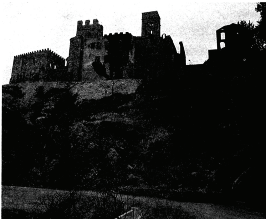
Fig. 1. Vista de la façana nord del monestir de Sant Pere de Rodes

La intervenció arqueològica en les dues darreres zones esmentades no s'ha acabat i, per tant, aquestes zones no són objecte d'aquesta tribuna. Centrem, doncs, el present article en el Refectori, Sagristies Noves i Palau de l'Abat.