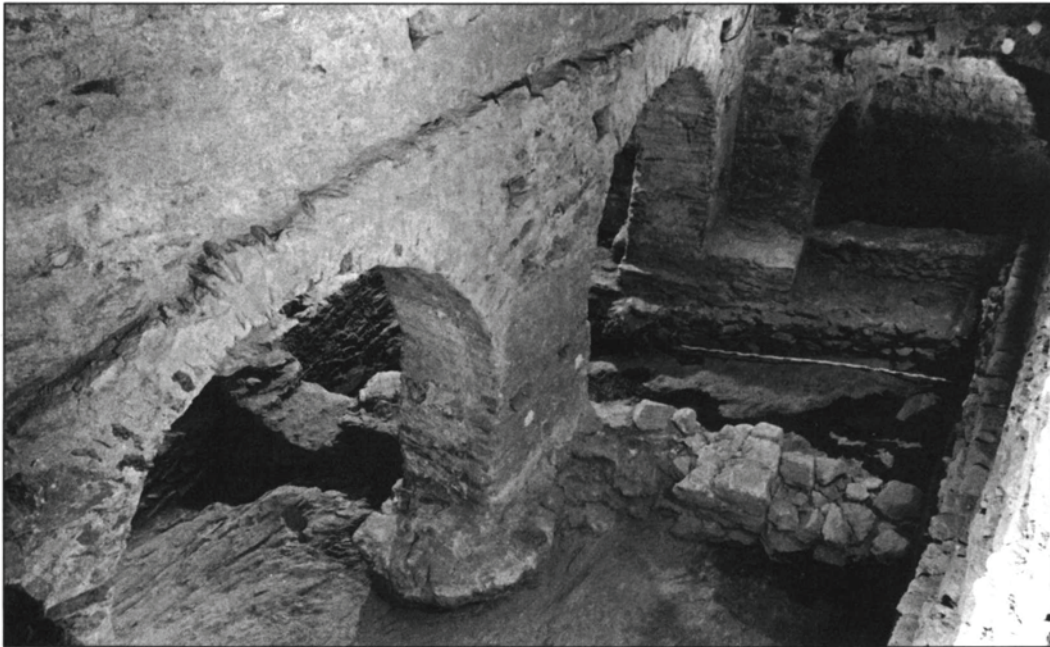
Fig. 2. Claustre del s. X-XI. Porxos de les galeries est a l'esquerra i sud al fons, amb restes de les estructures preexistents al subsòl (Foto J. Sánchez, 1992).