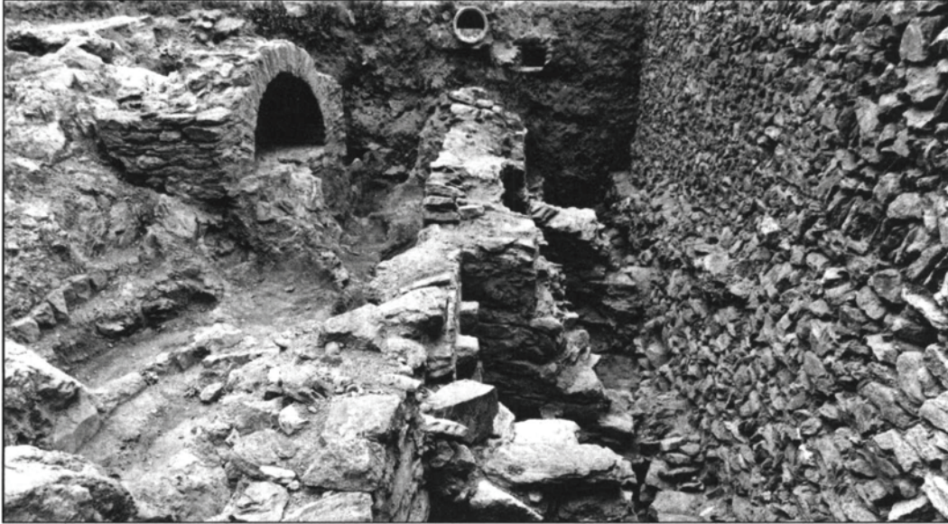
Fig. 1. Pati d'entrada. A l'esquerra arcosoli funerari, al centre mur de contenció del cementiri (s. XII-XII) i a la dreta mur de terraplenatge del pati posterior (Foto J. Sánchez, 1991).