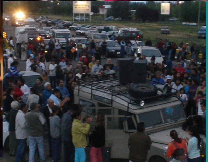
Delegación Fundación UNIDA Region de Cuyo - Argentina