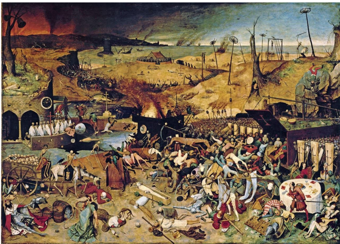
TRIOMF DE LA MORT. PIETER BRUEGHEL (1562) – MUSEO DEL PRADO, MADRID.

La pesta negra va ser un cataclisme que assolà Europa, provocant la mort d'una quarta part de la població del continent. Aquesta malaltia rebia el nom dels seus principals símptomes, doncs els infectats presentaven taques negres a la pell que sagnaven i treien pus, a més de dificultats respiratòries i deliris.