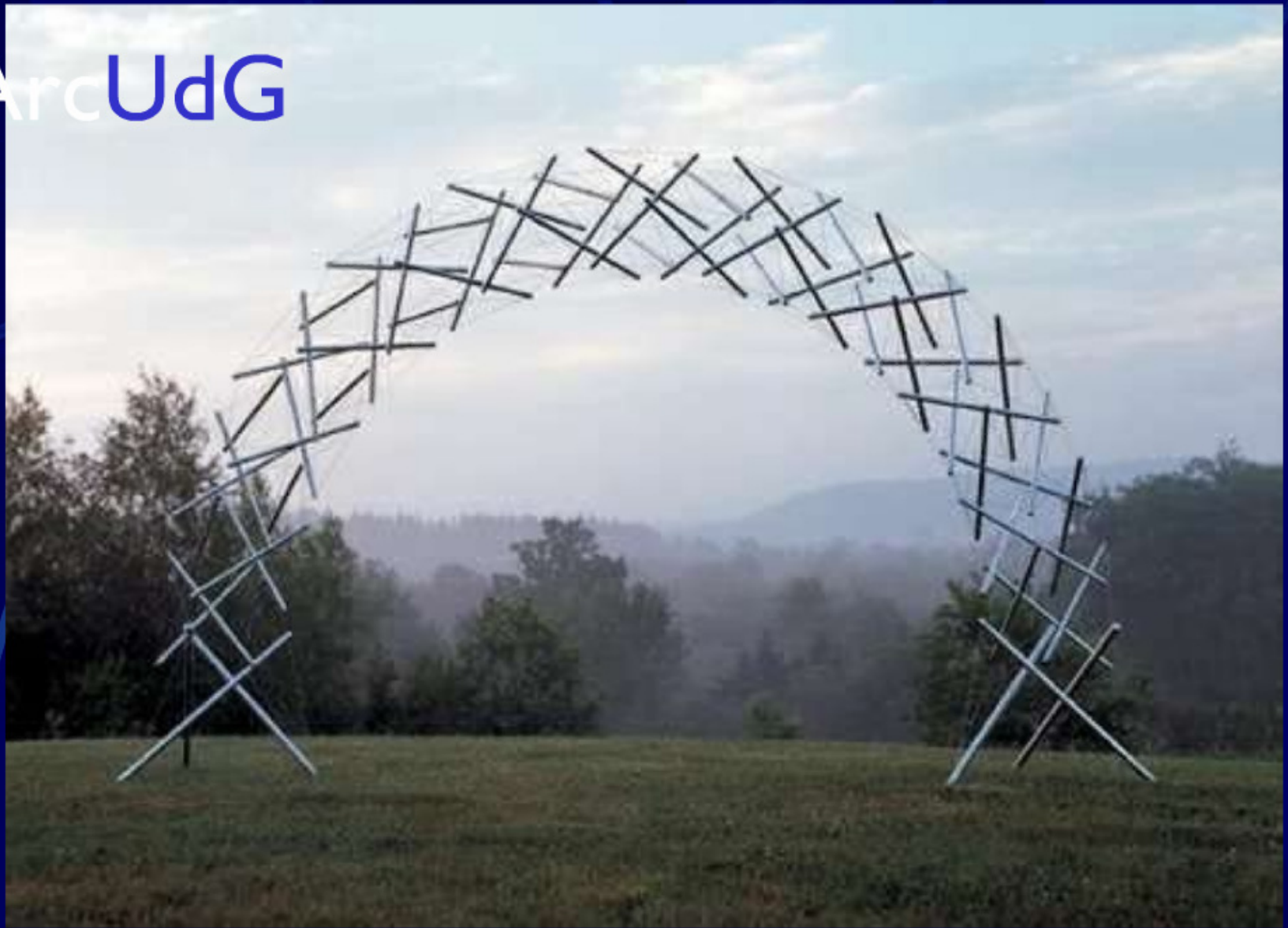
Kenneth Snelson, Rainbow Arch , 2001, aluminum & stainless steel, 2.1 x 3.8 x 1m