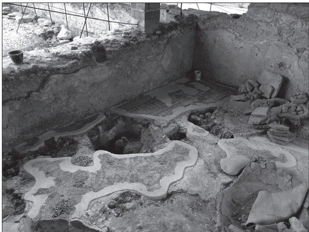
Figura 8. Mosaic de l'A40 durant el procés de consolidació i restitució de tessel·les.