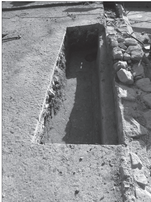
Figura 6. Detall del dipòsit existent sota el paviment del torculari (A23).

La troballa des de les primeres campanyes arqueològiques de paviments musius i elements com pintures o estructures d' opus signinum va posar de relleu la necessitat de crear un sistema de cobertura i protecció d'aquests elements. Per aquesta raó es va elaborar un projecte d'adequació -dirigit des del Servei de Monuments de la Diputació de Girona- que contemplava la creació d'una coberta per protegir la zona sud del jaciment. Aquest projecte ha estat aprovat per la Comissió de Patrimoni de la Generalitat de Catalunya i està finançat per ABERTIS a través de l'1% Cultural Ministerial. La construcció d'aquesta coberta requeria la construcció de quatre potents sabates de fonamentació que han estat objecte de