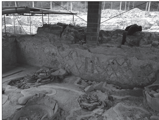
Figura 9. Vista de l'A40 durant els treballs de consolidació, amb les pintures parietals netes.

neteja mecànica en sec (raspalls, bisturís, espàtules) ajudats d'aspirador.