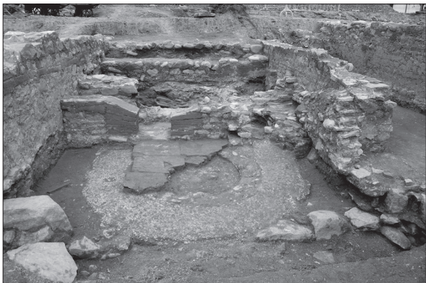
Figura 5. Vista general de l'àmbit 37.

situada al sud. Aquest espai està ocupat per nivells d'enderroc, entre els que s'han recuperat fragments de bipedals i moltes tessel·les de color negre, així com alguns fragments d' opus signinum . Per sota d'aquests nivells d'enderroc apareix una potent capa de cendres en les que s'han recuperat alguns tubuli .