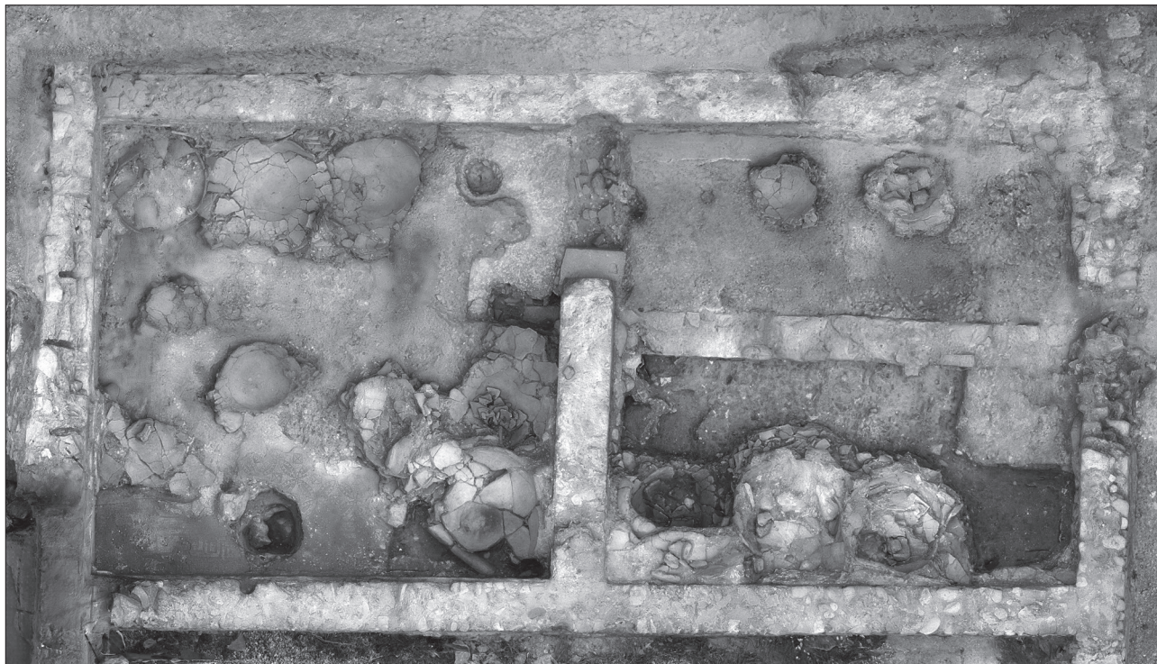
Figura 4. Vista aèria dels àmbits 34 i 40.

conservava el paviment d' opus signinum amb decoració de floretes. La decoració presenta la peculiaritat de que mentre que les flors de la banda de llevant són blanques amb una tessella central negra, les de la banda oest són negres amb el centre blanc. Aquest paviment també es conserva dins l'A34.