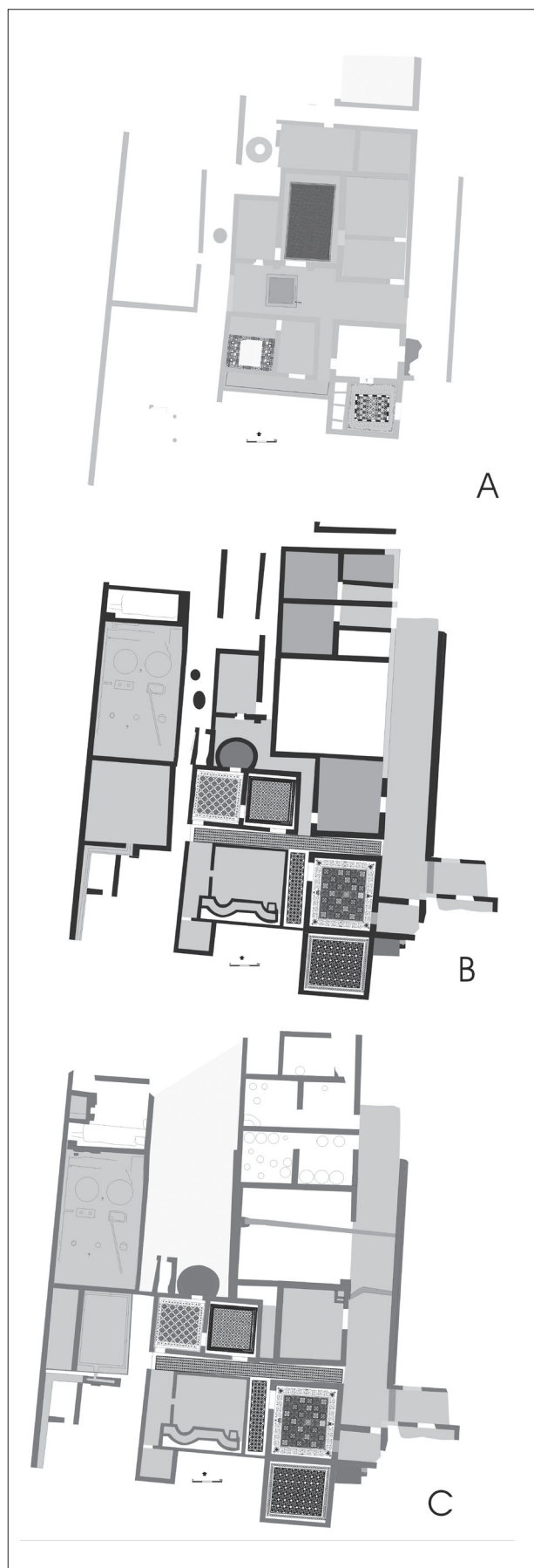
Figura 3. Principals fases de la vil·la; època augustal (A); finals del s.II (B); s.IV (C).

La cambra presenta una porta a l'angle sud-est, de la qual es conserven els blocs de calcària del llindar, amb dos petits encaixos de polleguera. El paviment de l'estança era un opus tessellatum policrom. La decoració del mosaic estava formada per una sanefa exterior formada per un filet simple de tesselles blaves, quasi negres, i un camp interior d'hexàgons delimitats en blau sobre fons blanc, amb una creu central del mateix color blau, i un rombe delimitant la creu fet amb tesselles vermelles i taronges. Al sector nord-oest s'han identificat tres forats que probablement es varen emprar com a encaixos per assentar-hi dolia . Aprofitant alguns dels espais on no s'ha conservat el paviment de mosaic es va aixecar la seva preparació posant de manifest alguns elements de fases anteriors. El primer que cal assenyalar és la localització de dos murs est-oest que prolonguen les alineacions estructurals que es detecten de forma molt més clara a la cambra A42 i que dibuixen la forma de l'espai en les fases prèvies a la configuració final de l'àmbit. Ambdós són fets amb pedres escairades només exteriorment i lligades amb fang.