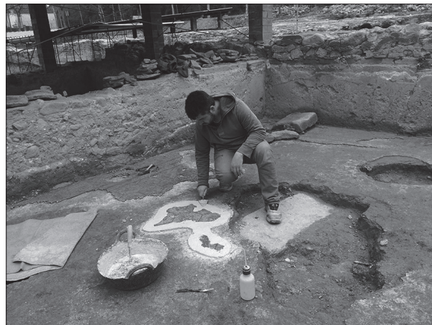
Figura 7. Treballs de consolidació de mosaics.

Els treballs arqueològics es varen complementar amb tasques de conservació i preservació in situ de les estructu-