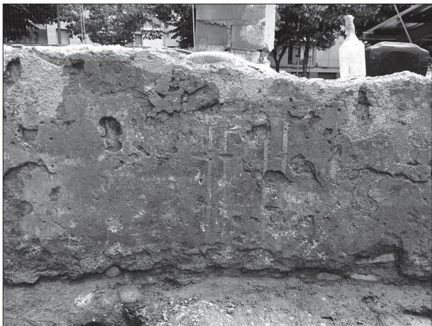
Figura 10. Detall de la pintura parietal de l'A41.

PALAHÍ, L., NOLLA, J.M., COSTA, A. 2014 , La vil·la romana del Pla de l'Horta (Sarrià de Ter, Gironès), Dotzenes Jornades d'Arqueologia de les Comarques de Girona , Besalú, 237-248.