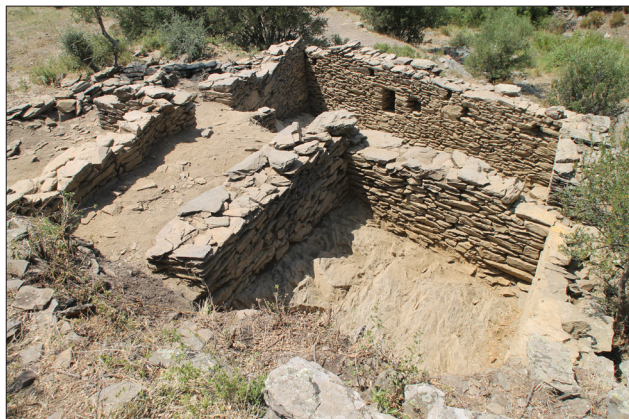
Figura 3. Vista general de la zona excavada.

En general, la seqüència és molt similar als diferents espais amb un potent paquet d'enderroc. A l'A5, amb tot, la quantitat de fragments de teules trobats fou més gran que