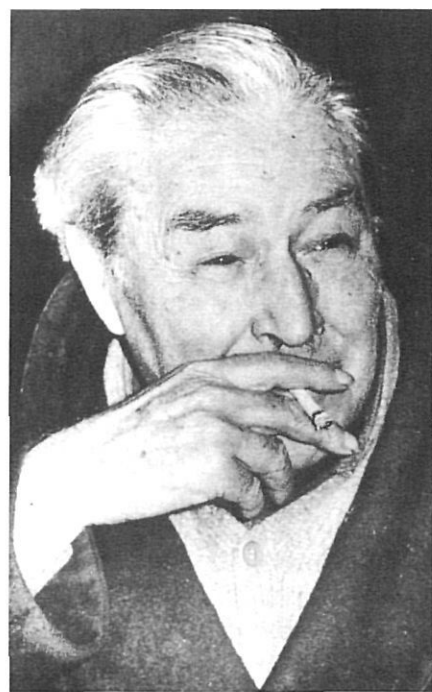
Els darrers anys de Pla.