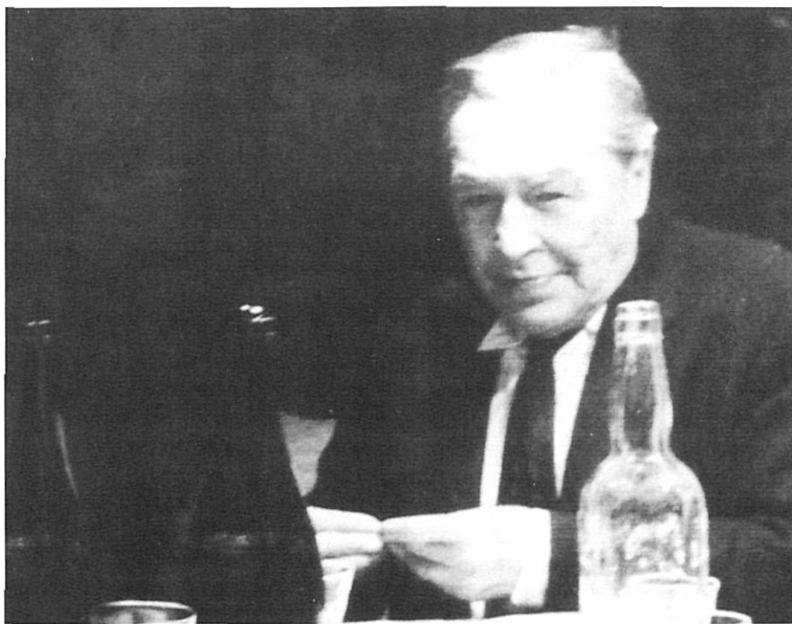
La cigarreta i l'ampolla, a la taula del Mas Pla.

escriptor de correspondència a Pere Pla i el Josep Pla escriptor d'autobiografia. I sobretot, no para esment en el fet referencial que la «biografia» és construïda, inventada, fictícia, resultat d'una reflexió entre el Josep Pla narrador i el Josep Pla personatge.