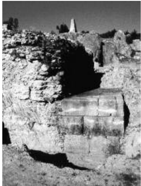
Figura 3. Panissars. Trofeus de Pompeu. Vista del costat septentrional de la plataforma est. Al fons, la plataforma occidental amb les grans rases de fonamentació.