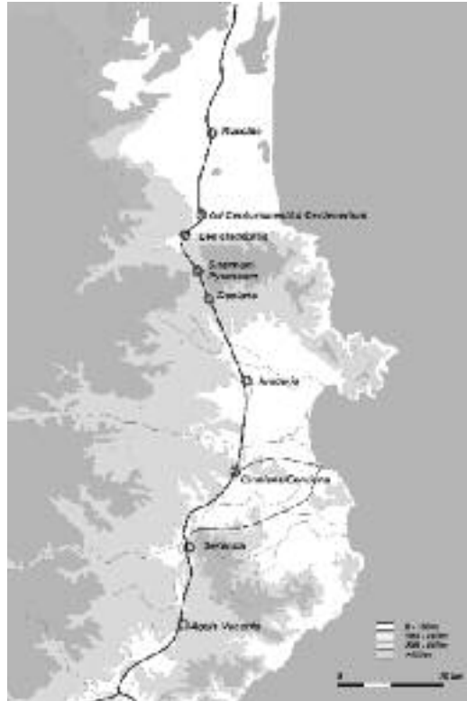
Figura 1. El territori a un i altre costat de l'Albera amb indicació del vell camí d'Hèracles, més tard Via Augusta i Via Domitia amb indicació de les mansiones i la localització de les clausurae.

a ponent, i el mar, a llevant. (3) Una diferència significativa i de llarguíssim abast del país dels indigets en relació amb els sordons i, de fet, amb tots els altres populi ibèrics d'Hispania, era la presència de dues poleis gregues, Emporion i Rhode , situades a un extrem i altre del golf de Roses. Convé recordar que les terres dels sordons i dels indigets eren travessades pel vell camí d'Hèracles que jugava un paper important en la vertebració d'aquelles terres i en la seva obertura al món, un protagonisme que s'accentuà després de la conquesta romana. (4) (fig. 1).