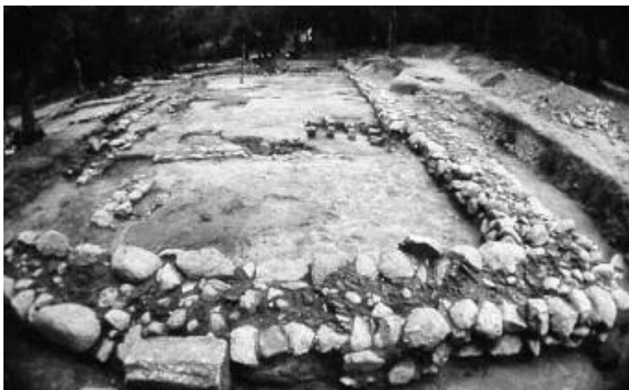
Figura 4. Camí de Panissars (la Jonquera). Mansio de Summus Pyrenaeus. Detall. Al fons, les pilae d'un hipocaust.