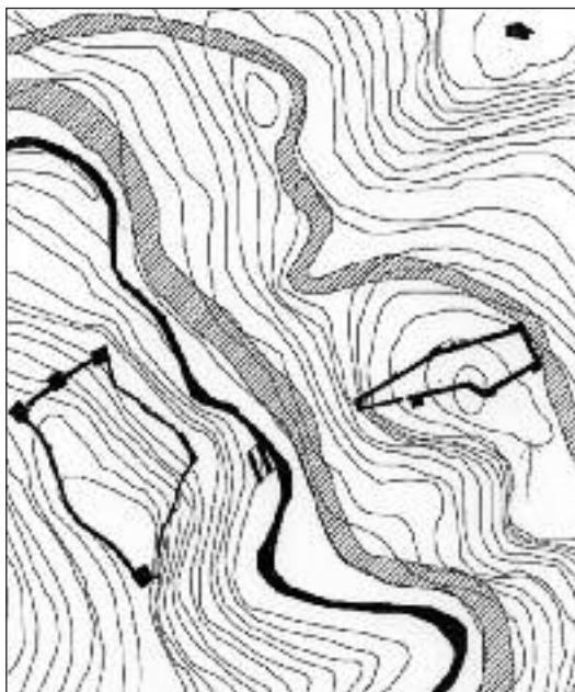
Figura 6. Les Clausurae. Planta general. A la dreta, la Clusa Alta i a l'esquerra, el castell dels Moros.

El conjunt de les Clausures és únic i es troba en un excel·lent estat de conservació. Consta de dos castells que s'aboquen directament sobre la vall de la Rom per on circulava el ramal principal de la Via Augusta-Domitia. Cap a llevant, a gran altura, la Clusa Alta, un castell de planta pseudopentagonal, d'obra potentíssima d' opus caementicium amb grans blocs de gres d'aprofitament