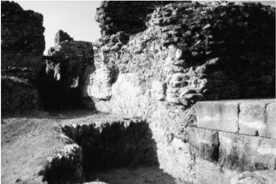
Figura 2. Panissars. Trofeus de Pompeu. Vista de la plataforma oriental des de l'angle nord-oest.