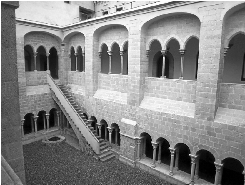
Fig. 9. Vista del claustre de Sant Daniel (autor: Anabel Moreno).