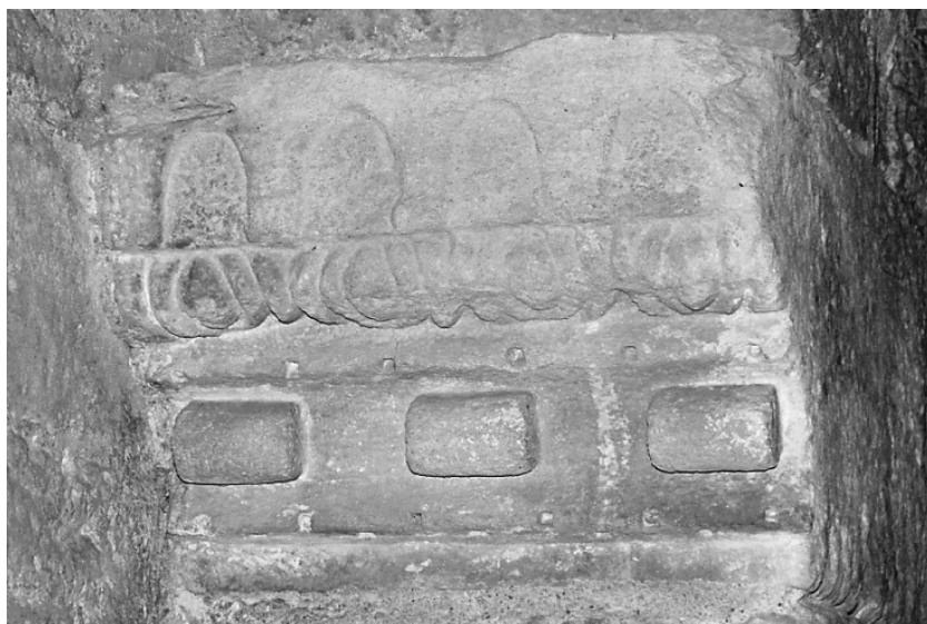
Fig. 5. Imposta de l'absis nord de Sant Daniel (autor: Anabel Moreno).

corat amb lesenes i arcs cecs entre els quals podem identificar els forats de bastida. No podem veure la totalitat de l'absis degut a una construcció posterior que oculta la meitat del semicercle. A l'interior, l'absis s'obre al transsepte amb un arc doblat en què destaquen dues impostes esculpides a banda i banda (fig. 5). El mur està format per rocs de mida reduïda col·locats de manera ordenada en registres horitzontals que culminen la semiesfera de l'absis. La resta del mur del braç nord del transsepte presenta diversitat de paraments, amb blocs de pedra de mida reduïda amb diferents acabats i disposicions que evidencien les constants modificacions sofertes. Al mur oest del braç nord del transsepte podem veure una porta d'arc de mig punt, de fusta, que connecta amb un espai contigu. A mitja altura, a la banda dreta, hi ha un arcosoli rectangular amb arc rebaixat. Sobre la porta, s'endevina una finestra de traça romànica aparedada que presenta les mateixes característiques que les finestres de la nau central.