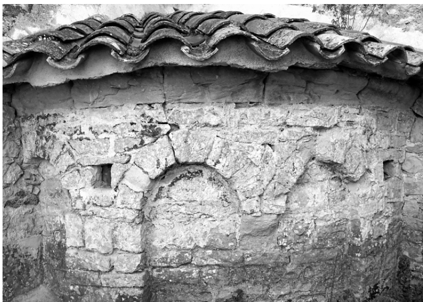
Fig. 4. Exterior de l'absis nord de Sant Daniel (autor: Anabel Moreno).