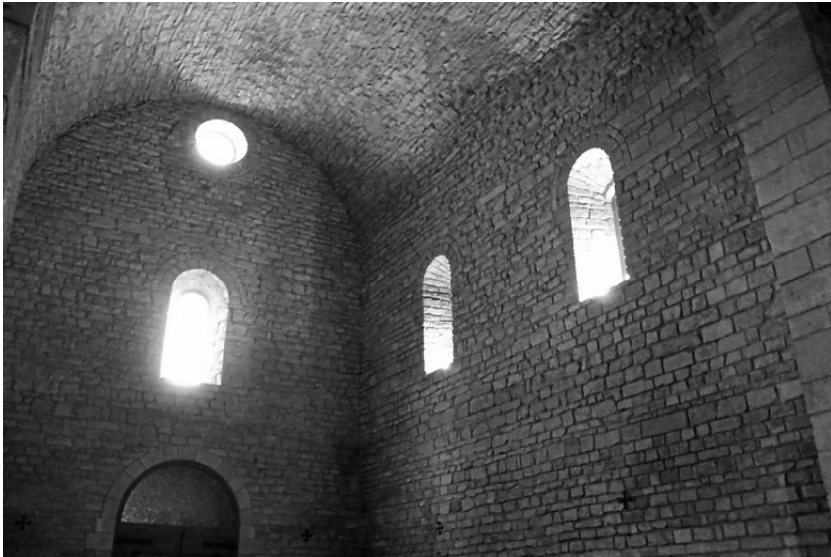
Fig. 7. Nau de l'església de Sant Daniel (autor: Anabel Moreno).

Des de les dependències adjacents al mur nord i des de l'andana superior del claustre es poden veure els arcs cecs i les lesenes, que, agrupades de dos en dos, decoren l'exterior del temple, igual que a l'exterior de l'església de Santa Maria de les Esglésies, Sant Ponç de Corbera i Sant Vicenç de Cardona.