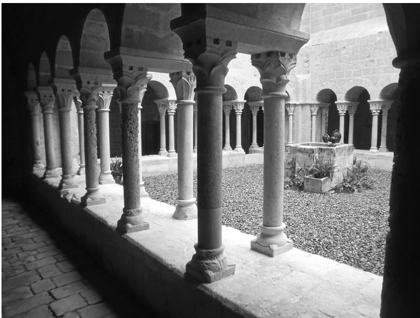
Fig. 10. Galeria romànica del claustre de Sant Daniel (autor: Anabel Moreno).