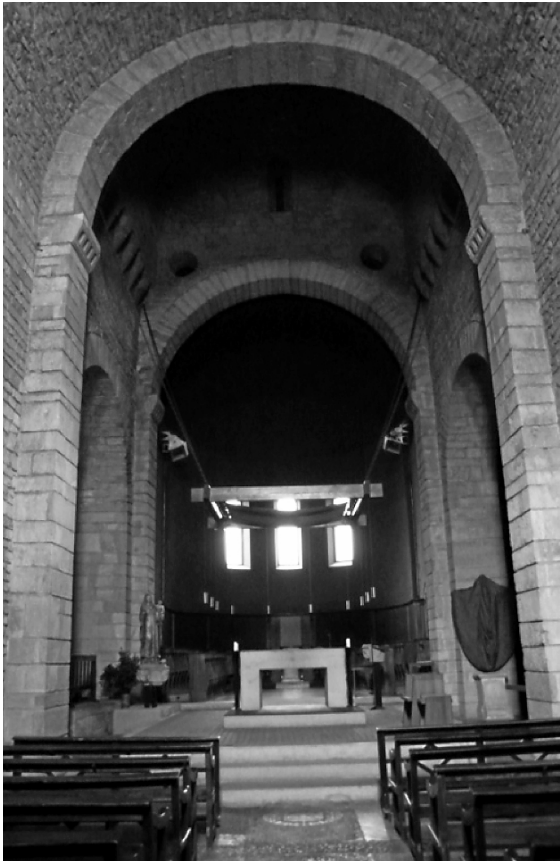
Fig. 2. Interior de la nau i absis central de Sant Daniel (autor: Anabel Moreno).

Un dels aspectes singulars del temple és la seva planta (fig. 1). Es tracta d'un dels pocs exemples catalans de planta centralitzada en creu grega. La capçalera està formada per un absis central i dues absidioles laterals. L'absis central semicircular té tres finestres de mig punt de doble esqueixada i està coberta per un quart d'esfera