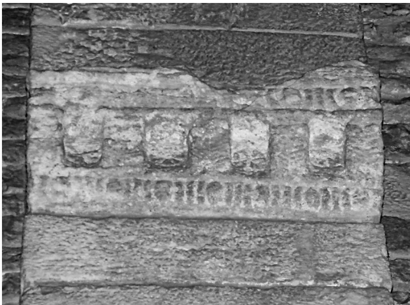
Fig. 6. Imposta dels arcs del creuer de Sant Daniel (autor: Anabel Moreno).

nou absis faria referència a aquest que esmentem i s'inscriuria en el procés de reforma del dormitori i la construcció del claustre.