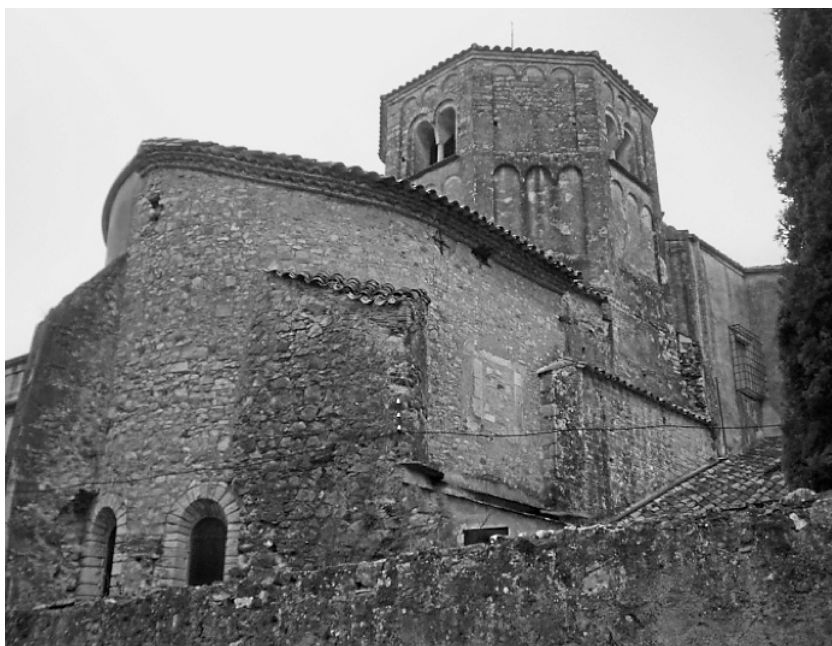
Fig. 3. Vista exterior de l'absis central i campanar de Sant Daniel.