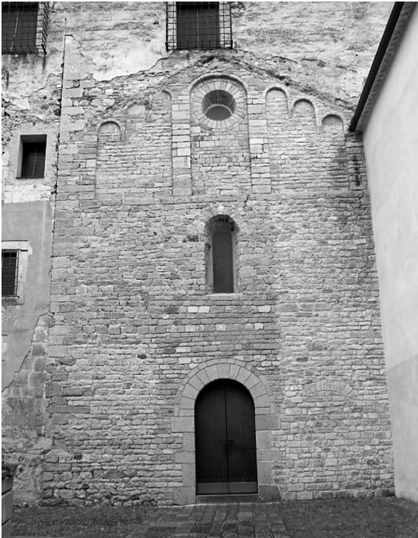
Fig. 8. Façana de l'església de Sant Daniel (autor: Anabel Moreno).

són fets de pedra sorrenca, i un cop superada l'altura dels motius llombards, són de pedra calcària.