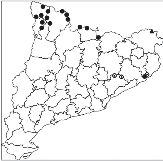
Fig. 1. Distribució actual de Sphagnum compactum (▲) i S. subnitens (●) [⊙ localitats desaparegudes] a Catalunya.