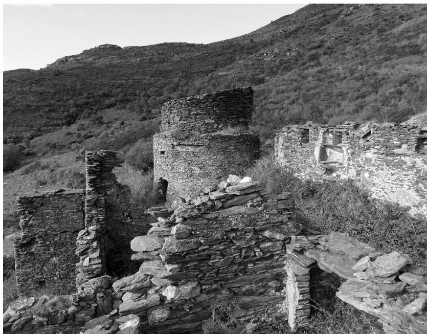
Mas d'en Figa.

“El mas era compost de planta baixa, un pis i annexos, els baixos on hi havia les quadres, els corrals i les pallisses; el pis, la vivenda per als amos, té les seves dependències molt enrunades, no queda cap teulada. Era un masia amb una superfície edificada bastant gran. Al costat oest hi ha una torre de defensa que conservava la part baixa fins a una alçada d'uns set metres. Separat uns cent metres al sud-oest de la torre, hi ha una borda o corral d'uns 20 metres quadrats en forma de rectangle, d'una sola planta. Prop d'ella, una font per a l'ús d'aigua de la casa i per regar l'hort i unes feixes on sembraven tota