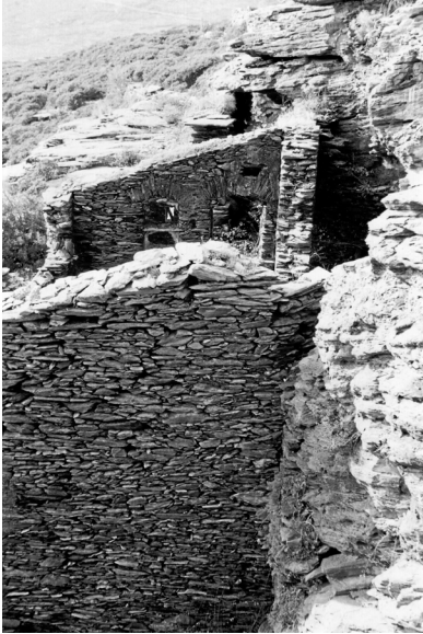
Mas de sa Roca.

motiu del plet termenal entre les universitats de Roses i Cadaqués, que es disputaven el valor estratègic del contrafort de muntanya que des del Pení es projecta directament al mar i exerceix durant tot el recorregut de divisió natural entre els termes municipals. El rosincs pretenien ser titulars de tota la carena i del tram nord, fins a l'altura de l'ermita de Sant Sebastià, que també consideraven seva, mentre que Cadaqués reclamava la part oposada, davallant fins a coincidir amb l'aiguavessant de Jóncols. Tot plegat, per la interpretació particular sobre el territori donat set segles enrere pel comte d'Empúries a l'abat