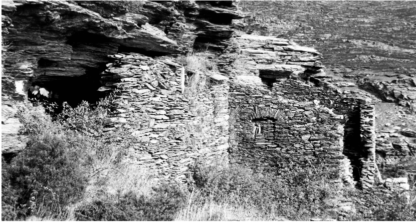
Mas de sa Roca.