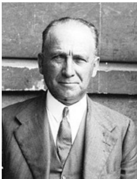
Francisco Largo Caballero

No fou fins al dia 8 de maig que la República aconseguí recuperar el control de la situació. Va ser necessari l'enviament de 5.000 guardes d'assalt per tal de pacificar la ciutat. Les anomenades "jornades de maig" es tancarien amb 500 morts i 1000 ferits segons la premsa de l'època.