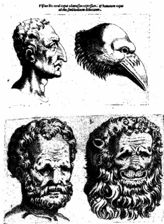
De humana physiognomia, de Giovanni Battista della Porta (1586). La imatge mostra l'aplicació del mètode zoològic. L'home amb aspecte de lleó i el front ben ample indica mediocritat d'intel·ligència.