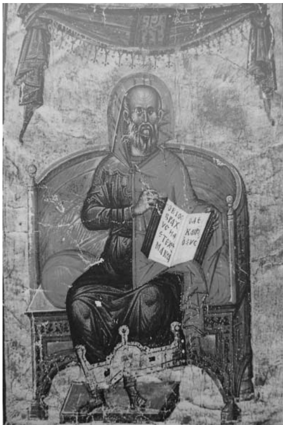
Hipòcrates representat en una miniatura bizantina del segle XIV

Atès que el saber fisiognomònic es podia utilitzar per identificar i corregir comportaments poc virtuoses, a partir del segle XIII les tipologies fisiognomòniques seran utilitzades per predicadors i moralistes en els seus discursos o sermons i esdevindran el centre d'interès d'un públic ampli, de cultura mitjana, que es convertirà en el potencial consumidor d'aquest tipus de textos. Estudiants i mestres d'arts, metges i astròlegs, reis i prínceps, consellers, nobles i burgesos, teòlegs i predicadors, i fins i tot aquells que han d'escollir esposes, criats o dides, buscaran informació en els textos fisiognomònics per no errar