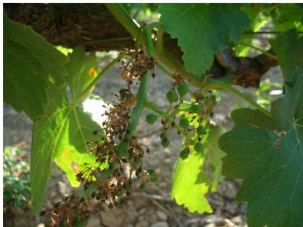
Etefon a l'estadi 29