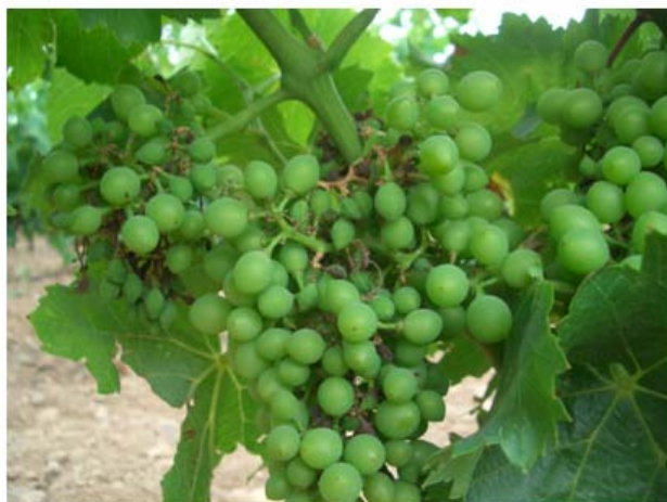
Etefon a l'estadi 31