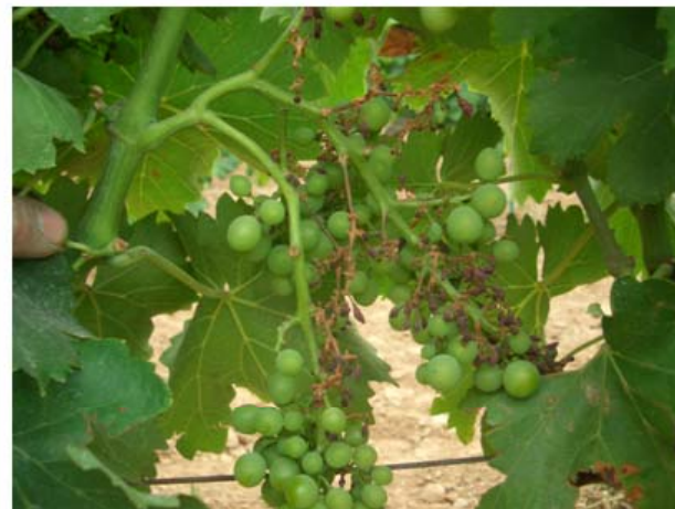
Etefon a l'estadi 30