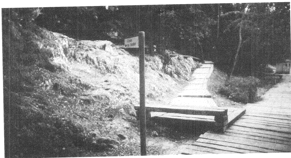
Fig. 1: Parc prehistòric de les coves de Serinyà. Accés a la cova de Mollet a partir del camí principal, situat a la part baixa del paratge i fet amb travesses de via de tren.