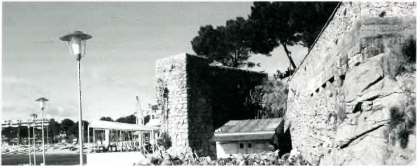
Vista general actual del moll medieval en el context del Club Nàutic de Sant Feliu de Guíxols.

Així doncs, Sant Feliu encetà el segle XVI amb un flamant moll. I, tanmateix, quan encara no havia transcorregut una centúria des que es començà la seva construcció, s'hi dugueren a terme noves intervencions.