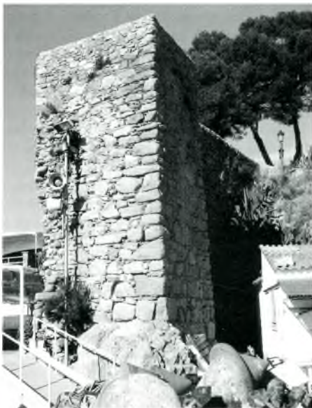
Vista de la part frontal de l'angle del moll.