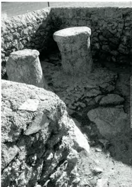
Detall de l'angle de l'estructura, per la banda interior, amb dos desgastats norais de calcària.

En definitiva, quatre anys hagueren de passar per recuperar completament el moll, quatre anys d'intensa activitat a la zona del port, per on arribaren a passar, en total, gairebé dues-centes persones entre obrers, mercaders i altres. Després del fracàs produït al cap de poc temps d'haver finalitzat l'edificació del primer moll, a causa de les dificultats per poder-lo mantenir, la universitat de la vila desenvolupà una manera d'obtenir els recursos necessaris. Així, decidí aplicar la imposició del mollaratge amb la pretensió de restaurar i millorar les estructures portuàries; ara bé, prengué la precaució de no caure per segona vegada en el mateix error i, per assegurar-se una afluència de recursos destinats a les tasques de manteniment, la taxa no deixà de recaptar-se després de 1594, ans es mantingué. D'aquesta manera, intentava afavorir, amb unes estructures en bones condicions, l'increment del tràfic portuari i, conseqüentment, augmentar la prosperitat econòmica de la vila.