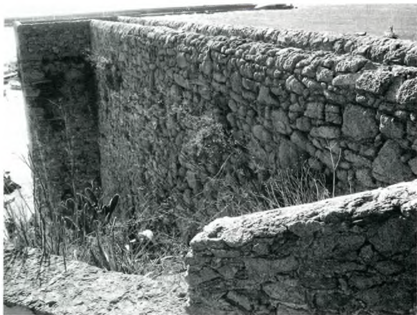
Vistes laterals del moll del Fortim estant.