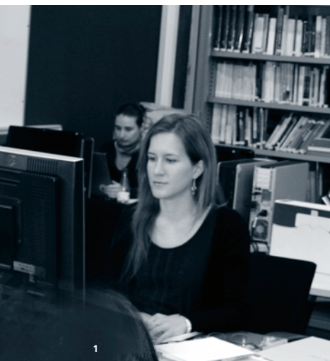
1. Seu de l'Institut Català de Recerca en Patrimoni Cultural.

visió primera i sumària ens indica que, després de molts anys amb una escassa atenció, les universitats i els seus científics s'estan interessant molt més per les recerques sobre el patrimoni i els museus. Estem en un moment en què semblen despertar-se nous interessos i probablement aquest sigui un camp emergent.