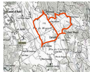
Plana agrícola de Cartellà i entorns de Sant Medir