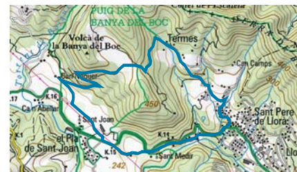
Puig de la Banya del Boc i Clot de l'Omera