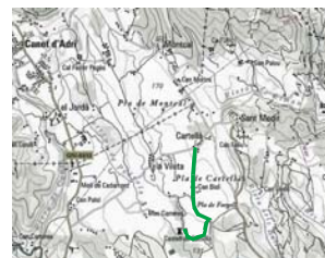
Castell de Cartellà