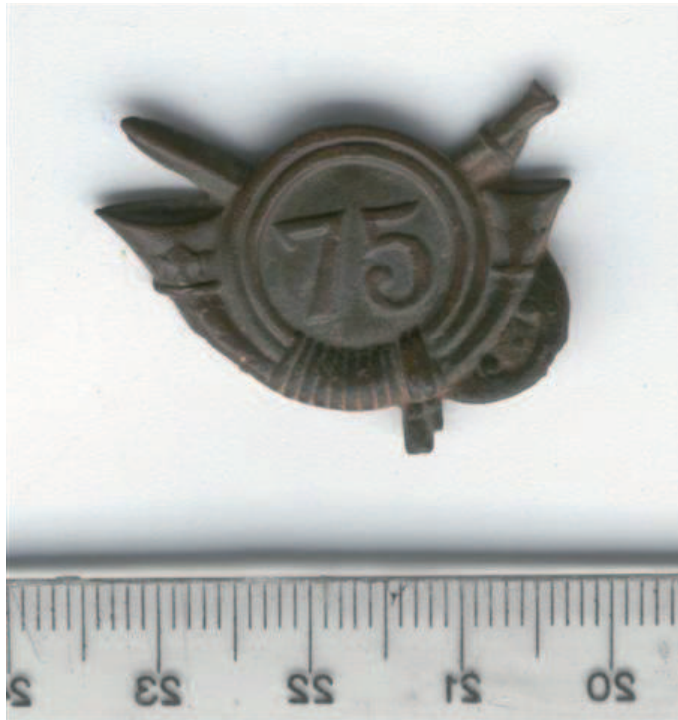
Insígnia de la 75 Brigada Mixta

un soldat anònim, però esbrinar si va sobreviure o no a la guerra i, en aquest darrer cas, quina va ser la seua vida a partir d'aquell moment, és tasca per a un altre treball.