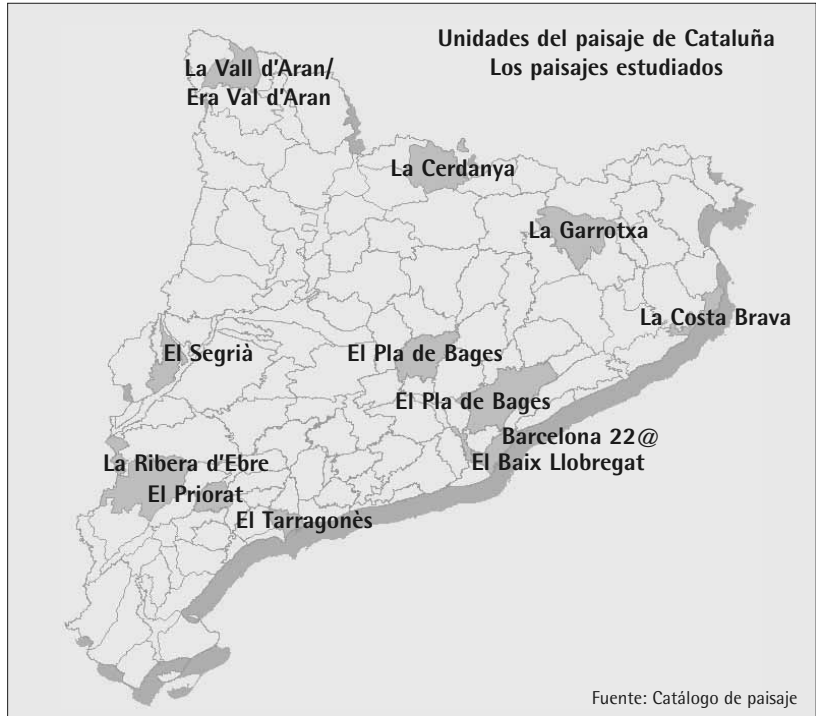
Imagen 2. Localización de los paisajes estudiados

En cualquier problemática que abordamos encontramos detrás la influencia de las áreas urbanas. Es el caso, por ejemplo, de la utilización como espacio de ocio urbano de paisajes aparentemente rurales donde las actividades económicas del sector terciario relacionadas con el turismo y la segunda residencia son totalmente dominantes, mientras que las actividades agrarias o ganaderas retroceden.