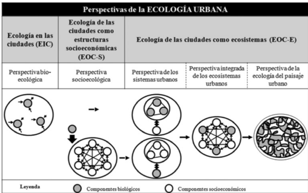
Figura 1 ESQUEMA DE LAS CINCO PERSPECTIVAS ECOLÓGICAS EN LOS ESTUDIOS DE ECOLOGÍA URBANA

Wu (2008) distingue cinco perspectivas ecológicas según la aproximación de los diferentes estudios de ecología urbana: la ecología en las ciudades (EIC) (1), la ecología de las ciudades entendidas como estructuras socioeconómicas (EOC-S; 2), y tres perspectivas que se desprenden de la ecología de las ciudades entendidas como ecosistemas (EOC-E; 3), y que el autor llama perspectiva de los sistemas urbanos (3), perspectiva integrada de los ecosistemas urbanos (4) y perspectiva de la ecología del paisaje urbano (5) (Figura 1).