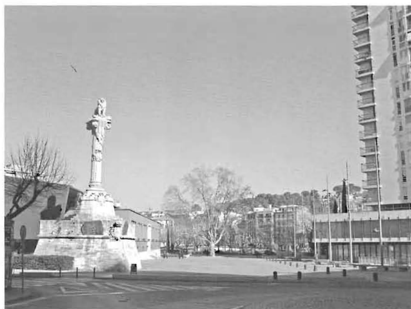
Vista de la plaça del Lleó actualment.