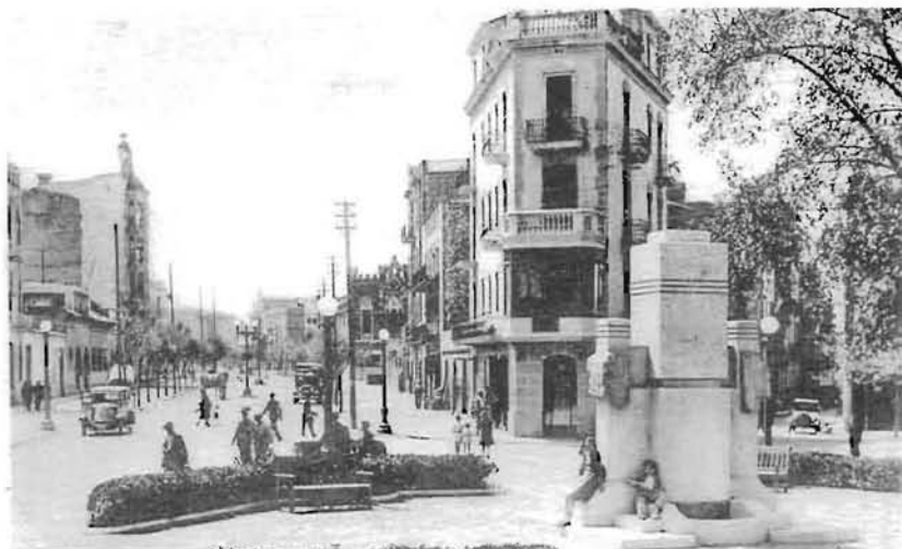
Perspectiva de la Gran Via en els anys vint (Foto AHCOAC. Hauser i Menet).