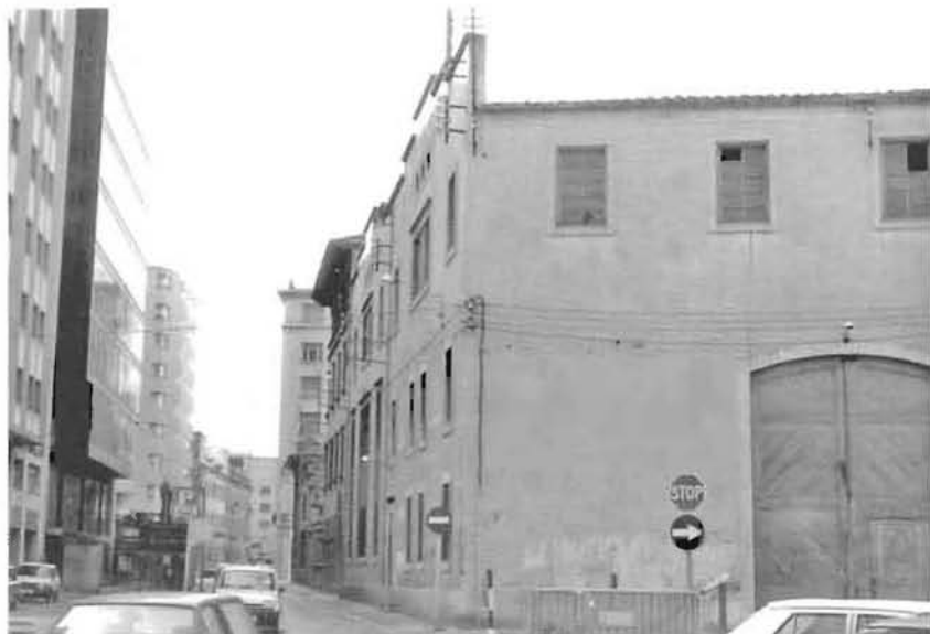
Vista del carrer Sèquia amb les naus de la fàbrica Grober a la dreta.