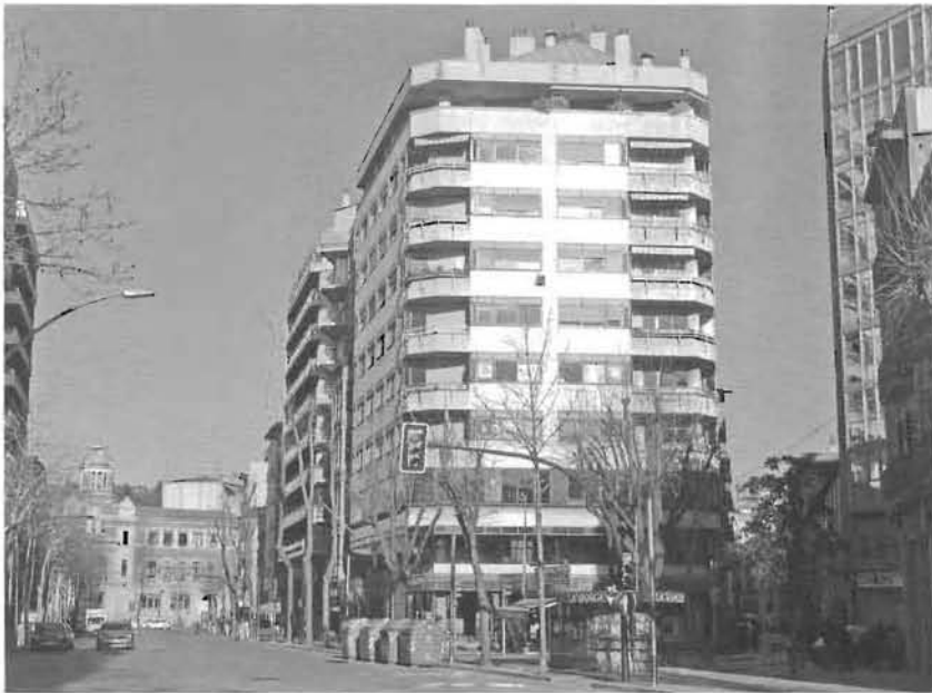
Vista de la Gran Via en l'actualitat.