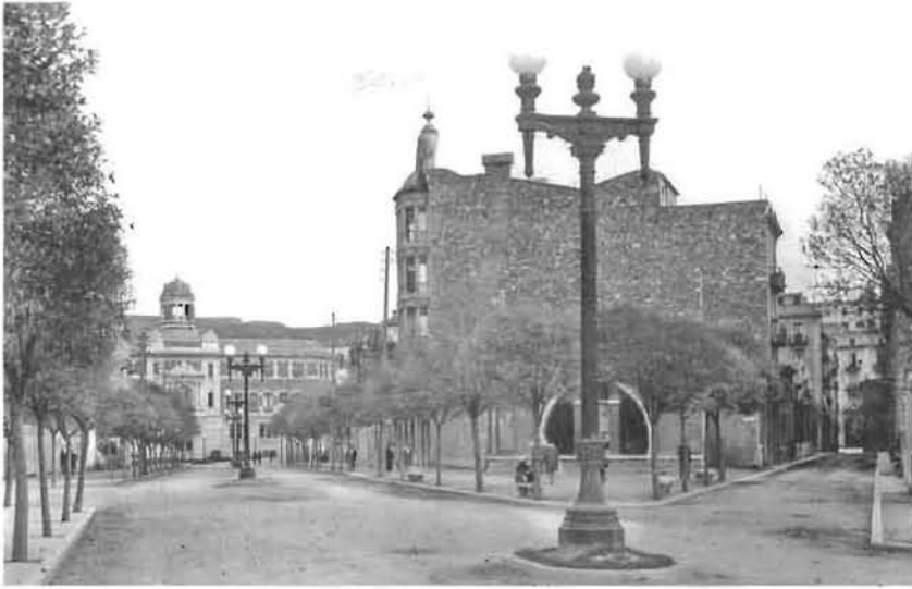
Vista de la Gran Via amb l'edifici de Correus acabat d'inaugurar.