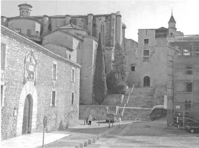
Vista de l'edifici de Les Àligues i el convent de Sant Domènec en l'actualitat.