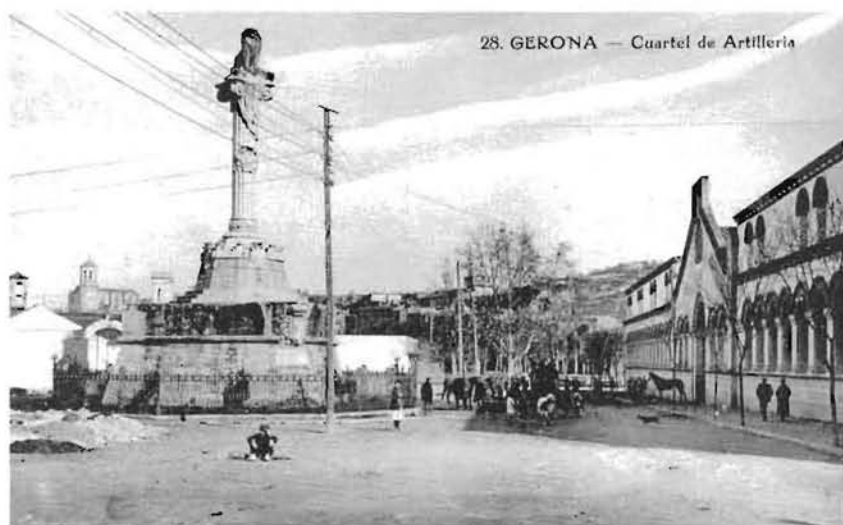
Vista de la plaça del Lleó amb la caserna General Mendoza. (Foto AHCOAC. Hauser i Menet).