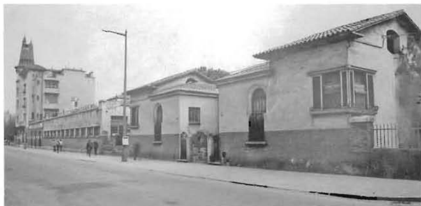
Vista del carrer de Santa Eugènia amb les cases de la urbanització a primer terme i la casa de La Punxa al fons.