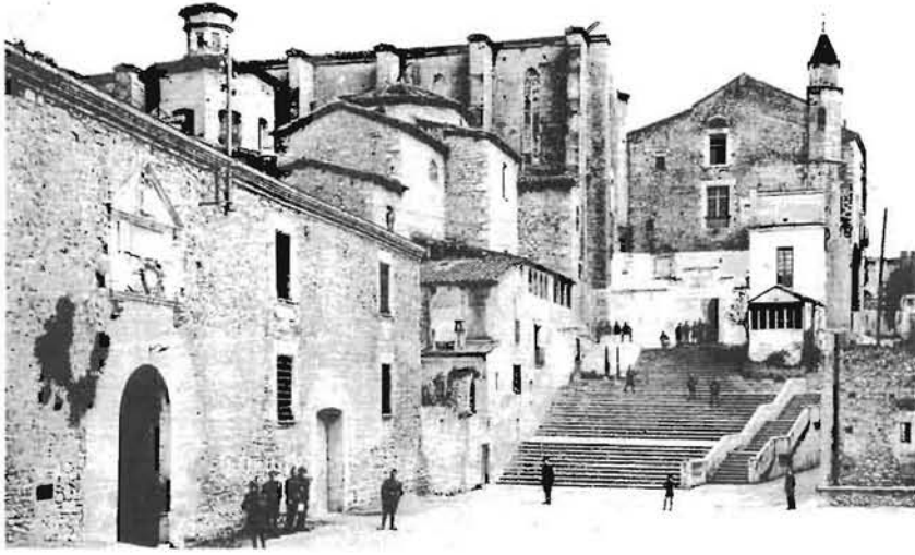
Vista del conjunt de Les Àligues i el convent de Sant Domènec durant el seu ús militar.