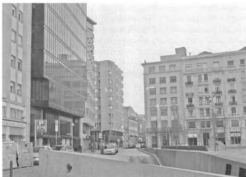
Vista del carrer Sèquia i la plaça Constitució a la seva dreta..