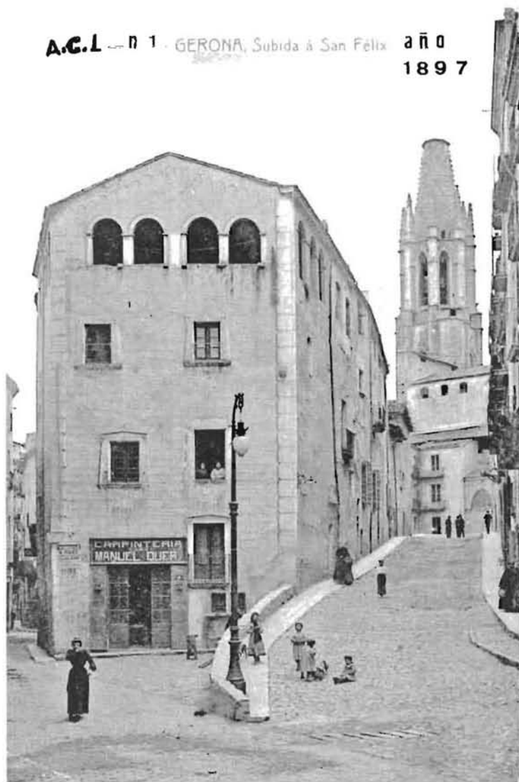
Vista de la Pujada de Sant Feliu abans de la intervenció de Ricard Giralt Casadesús.

A.C.L. -- n 1 - GERONA, Subida a San Fèlix año 1897