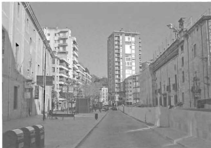
Perspectiva de la plaça de l'Hospital l'any 2008. (Foto C. Ribera).