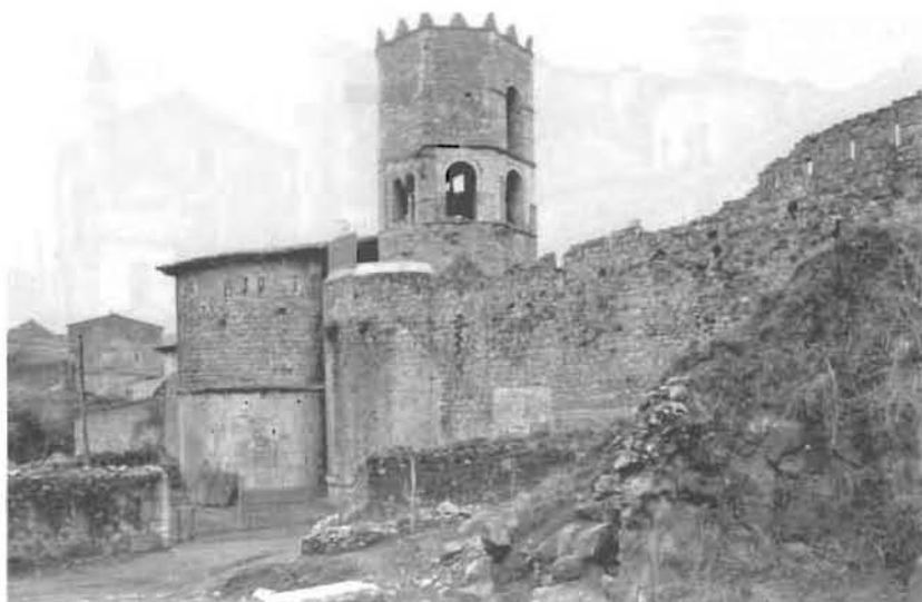
Perspectiva de la part posterior de Sant Pere de Galligants encerclat per la muralla.