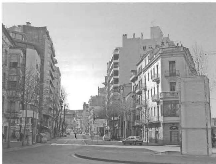
Perspectiva de la Gran Via en l'actualitat. (Foto G. Domènech).