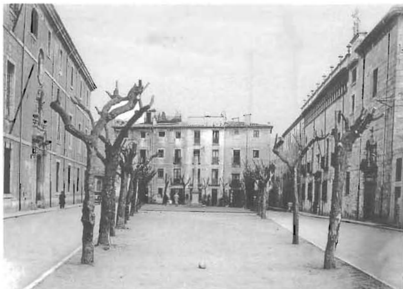
Perspectiva de la plaça de l'Hospital l'any 1935. (AHOAC).