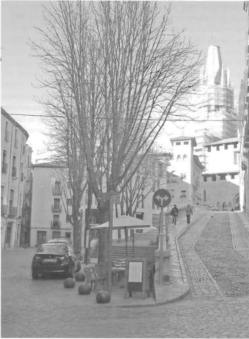
Vista de la Pujada de Sant Feliu en l'actualitat.