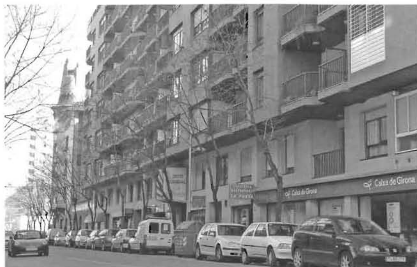
Vista del carrer de Santa Eugènia en l'actualitat.