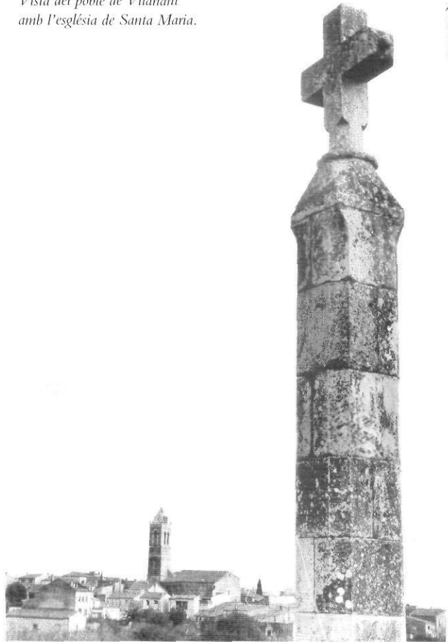
Vista del poble de Vilanant amb l'església de Santa Maria.

és professor de l'Escola Universitària de Turisme de la UdG.