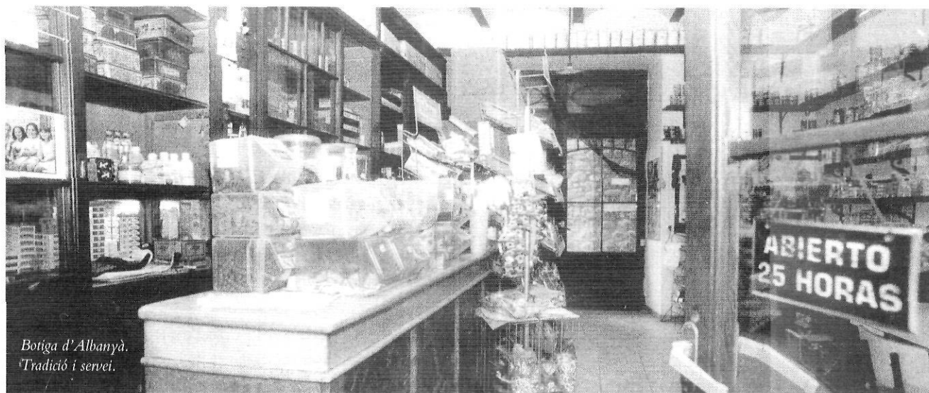
Botiga d'Albanyà. 'Tradicció i servei.'

La regió de Salines-Bassegoda és també un excel·lent exponent de la vitalitat dels espais més septentrionals de Catalunya durant l'alta edat mitjana. Els elements patrimonials que hem heretat d'aquest període no tenen un valor singular destacable,