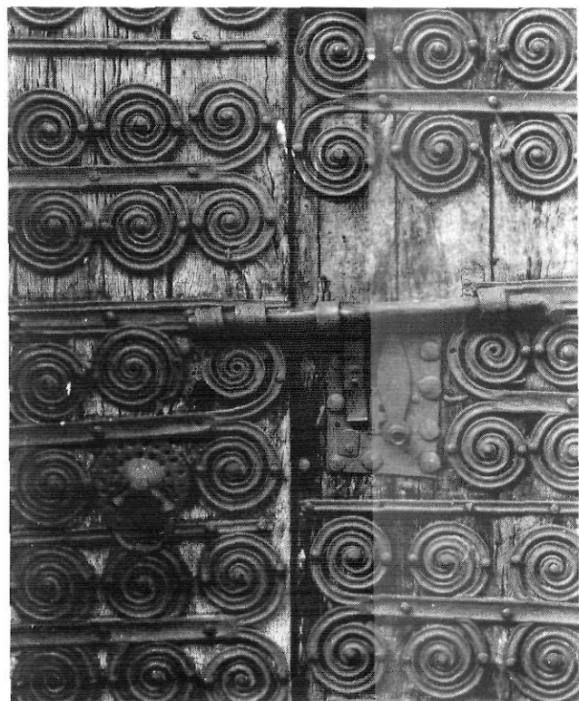
Santa Coloma de Cabanelles. Porta romànica de ferramenta clavetajada.