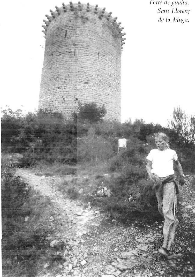
Torre de guaita. Sant Llorenç de la Muga.

Tanmateix, el pols turístic de la regió no està tan determinat pels turistes com pels excursionistes i els segons residents. Els excursionistes són els visitants que no realitzen una pernactació en l'àrea de destinació; la majoria dels visitants tenen la seva residència a l'àrea metropolitana de Barcelona o bé estan allotjats en els nuclis de la costa més septentrional. Les segones residències han tingut una incidència significativa en aquest espai. El cens d'habitatges de 1981 ja testimoniava una presència destacada en els municipis de Maçanet de Cabrenys, Agullana, Llers o Damius. En termes relatius, el nombre d'habitatges secundaris i vacants superava el dels habitatges principals de la Vajol, Sant Llorenç de la Muga o Albanyà. El cens de 1991 va testimoniar l'increment d'aquest fenomen, si bé a un ritme inferior que en altres regions veïnes. Encara no es disposen de les dades del cens d'habitatges de 2001, però les previsions realitzades a partir del Col·legi d'Arquitectes dibuixen un escenari en el qual les segones residències superen els habitatges principals a tots els municipis excepte a Navata.