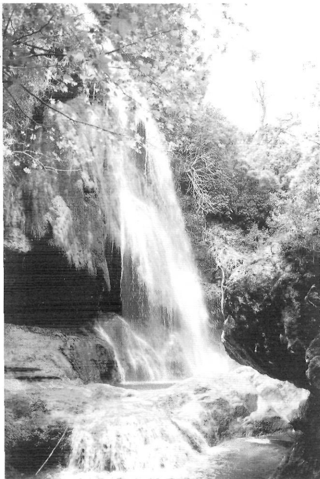
Salt d'aigua de La Cauta. Les Escaules.

però sí un interès en el seu conjunt. Amb l'excepció de la ponderada església de Santa Maria d'Agullana, declarada bé cultural d'interès nacional el 1984, i d'algunes peces aïllades, el principal interès del patrimoni d'aquesta regió és l'elevada concentració de monestirs i esglésies en un territori reduït: el monestir benedictí de les Escaules a Boadella, l'església de Santa Eugènia d'Agullana, Santa Maria de Darnius, el monestir romànic de Sant Llorenç de Sous, Sant Pere d'Albanyà, el santuari de Mare de Déu del Mont, l'església preromànica de Sant Briç de Maçanet de Cabrenys... La suma d'aquests centres permet imaginar un espai de recorregut que s'aproximi (amb les distàncies necessàries) al model turístic promogut des de la Vall de Boí. En aquest cas, l'essència de l'oferta turística del territori es basa en la construcció d'itineraris.