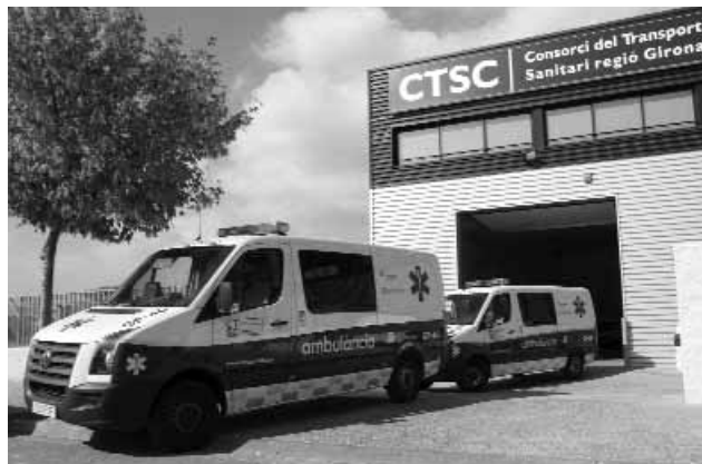
Ambulàncies del Consorci Sanitari.

El primer Pla de salut de Catalunya es va publicar l'any 1991. Amb aquell document i els successius que s'han elaborat, ara fa més de 10 anys, s'han portat a terme tot un seguit d'intervencions i s'ha fet una anàlisi dels resultats aconseguits. El balanç ha estat satisfactori, i així ho demostra el fet que s'han assolit tres quartes parts dels objectius proposats, en concret, el 67,3% en la seva totalitat i el 8,9% parcialment.