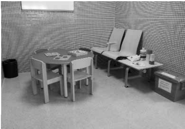
Sala d'espera d'un CAP.

escriure, que més de la meitat ha cursat estudis primaris, que el 29% té un nivell d'estudis secundaris i que només un 17% cursa estudis superiors. La presència immigratòria a les comarques gironines constitueix un 18, 78% del total de la població, xifra important afavorida, sens dubte, per la llei d'agrupament familiar, que fa possible la implantació de nombroses famílies estrangeres al nostre territori.