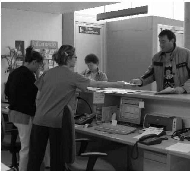
Tauler de recepció del CAP de l'Escala.

més prescrits són analgèsics, diürètics, hipoglucemians orals, broncodilatadors i psicofàrmacs.