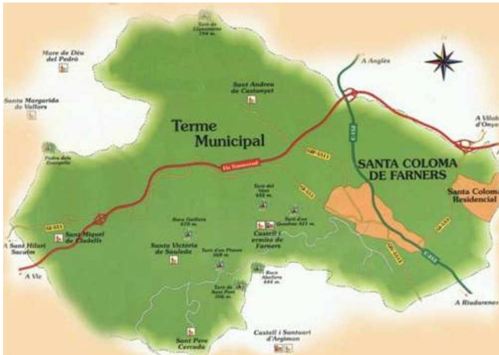
Imatge 3: Mapa del terme municipal de Santa Coloma de Farners