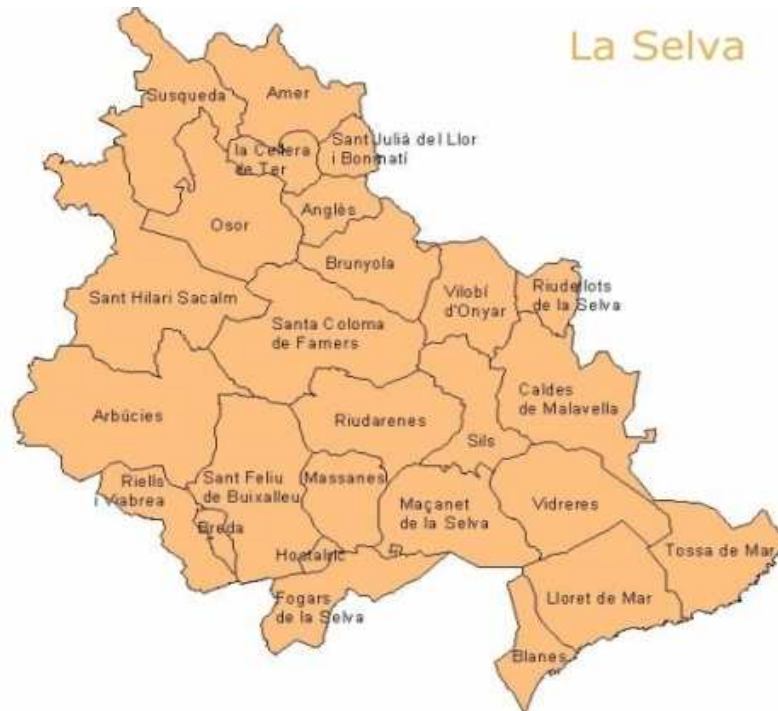
Imatge 2: Mapa de la comarca de La Selva

El terme municipal de Santa Coloma de Farners té 71,31 km 2 . Es troba situat a la part central de la comarca de la Selva, al sector de contacte entre la Serralada Prelitoral (extrem oriental del Montseny i sud de les Guilleries) i la depressió gironina. El terme actual limita a tramuntana amb els termes d'Osor i Brunyola; al sud, amb Riudarenes i Sant Feliu de Buixalleu; a llevant, amb Vilobí d'Onyar i Riudarenes, i a occident, amb Sant Hilari Sacalm i Arbúcies. Inclou els veïnats i les parròquies de Sant Miquel de Cladells, Sant Pere Cercada, Castanyet, Vallors i Vall. La ciutat s'aixeca a la plana, sobre una terrassa fluvial, però el sector nord-occidental del terme comprèn una ampla zona de muntanyes que no arriben als 1.000 metres.